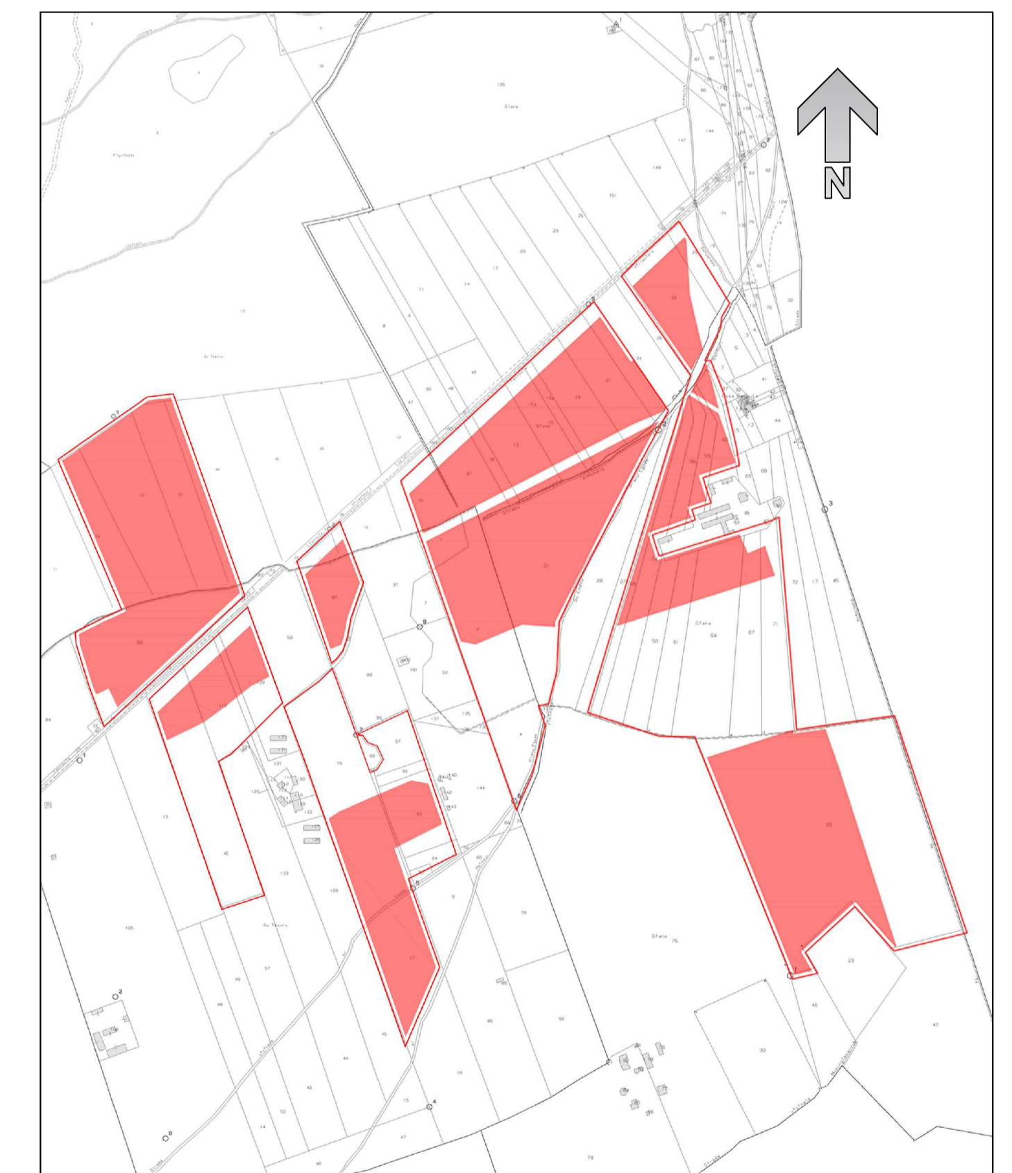
PLANIMETRIA CATASTALE SCALA 1:10.000