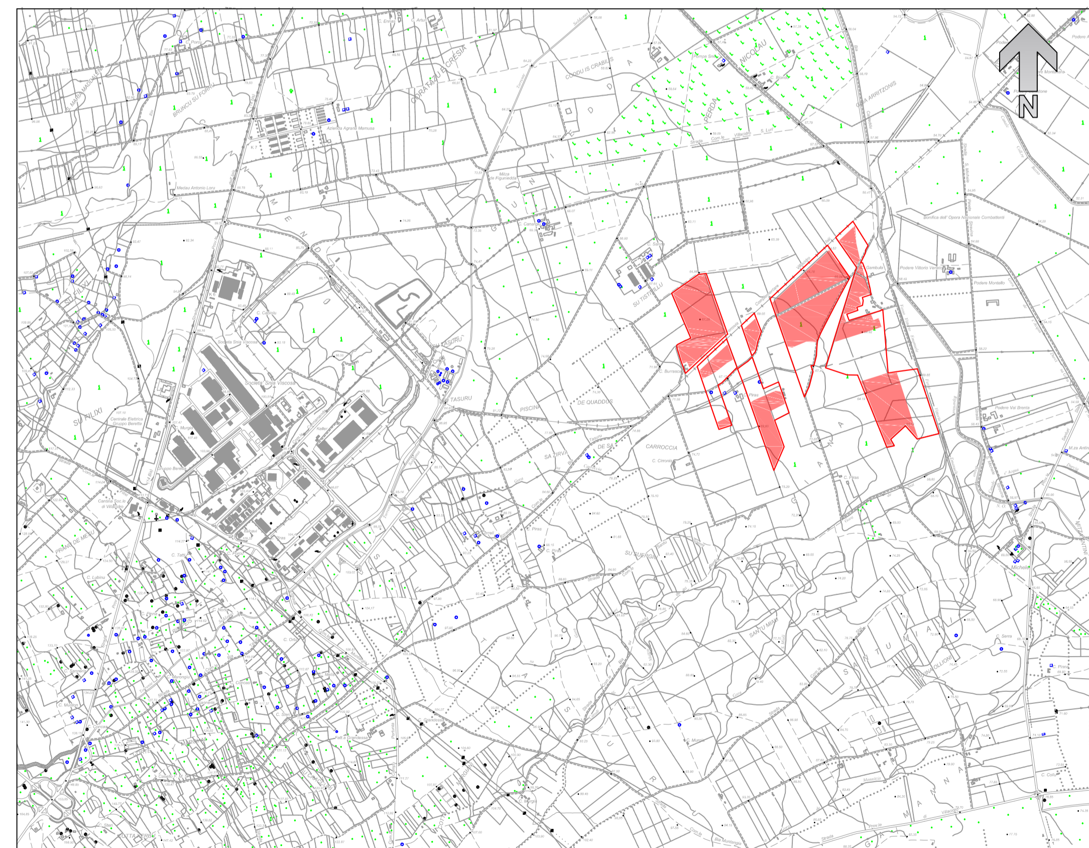
C.T.R - FOGLI 547060-547100 SCALA 1:25.000