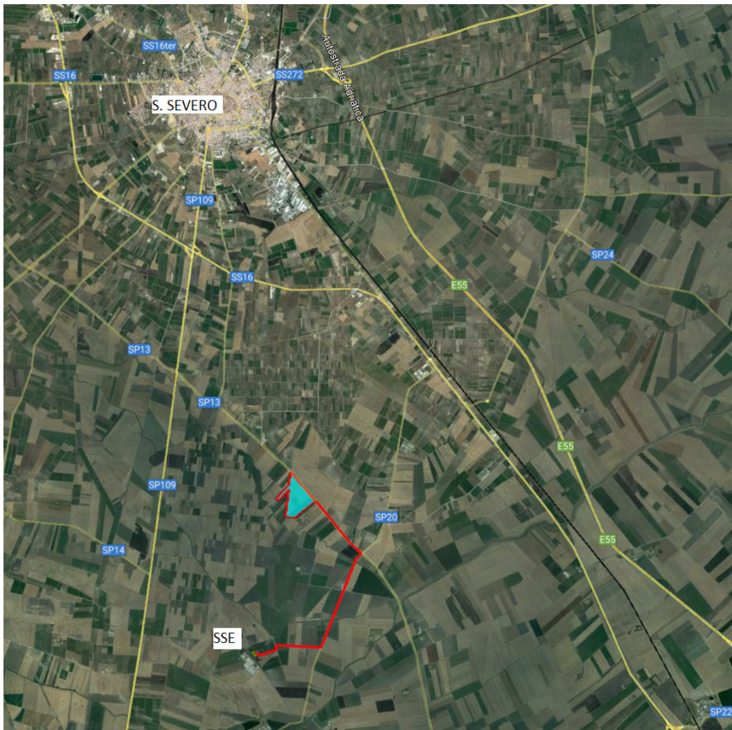
Figura 2.1: Localizzazione dell'area di intervento (CIANO: impianto; ROSSO: connessione)

La connessione dell'impianto avrà un tratto di cavo interrato in MT dalla cabina di trasformazione, posta all'interno dell'impianto, fino alla Stazione di Elevazione MT/AT posta nelle immediate vicinanze della SSE denominata "S. Severo". Dalla Stazione di Elevazione con elettrodotto interrato in AT, lungo qualche centinaio di metri, si arriverà al punto di allaccio finale nella sottostazione di trasformazione della RTN 380/150 kV ubicata a ubicata a circa 10 km a N-E di Lucera. Complessivamente la connessione avrà una lunghezza di circa 5 km fino alla Stazione di Elevazione.