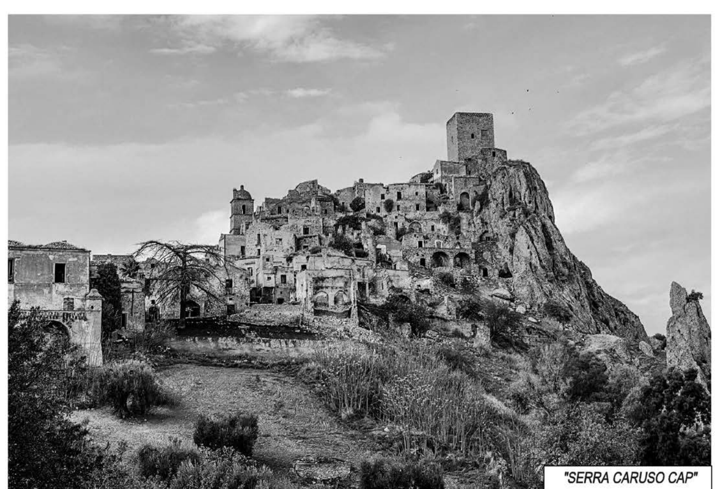
"SERRA CARUSO CAP"