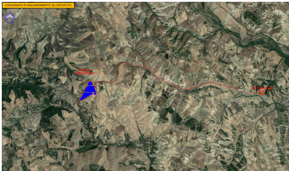
Figura 1 - Inquadramento su ortofoto dell'impianto (stralcio tavola A12a1-3)

Il sito è ubicato in provincia di Matera nel comune di Craco ed è costituito da 14 particelle del Foglio di mappa n. 22, particelle n.67, n.50, n.55, n.56, n.72, n.57, n.112, n.161, n.162, n.92, n.95, n.59, n.174, n.93, per una superficie totale di circa 28.9 ettari .