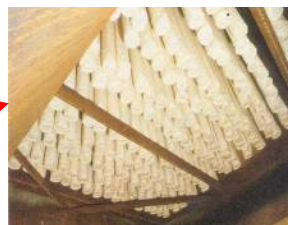
Gruppi di maniche filtranti: investite dal flusso di gas, trattengono il particolato sottile