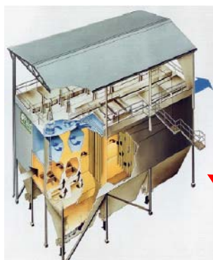
Filtro a maniche

Le immagini seguenti mostrano lo schema costruttivo di un tipico filtro a maniche.