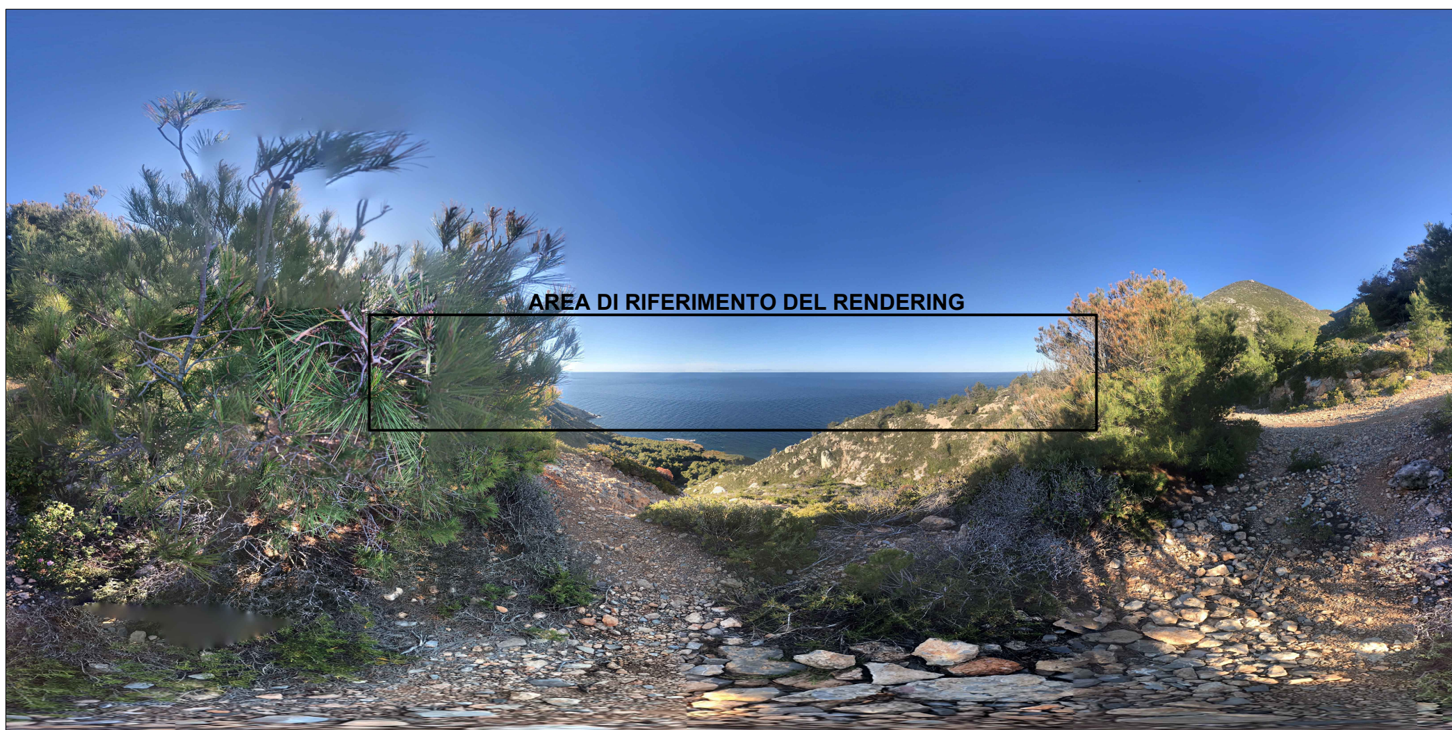
AREA DI RIFERIMENTO DEL RENDERING