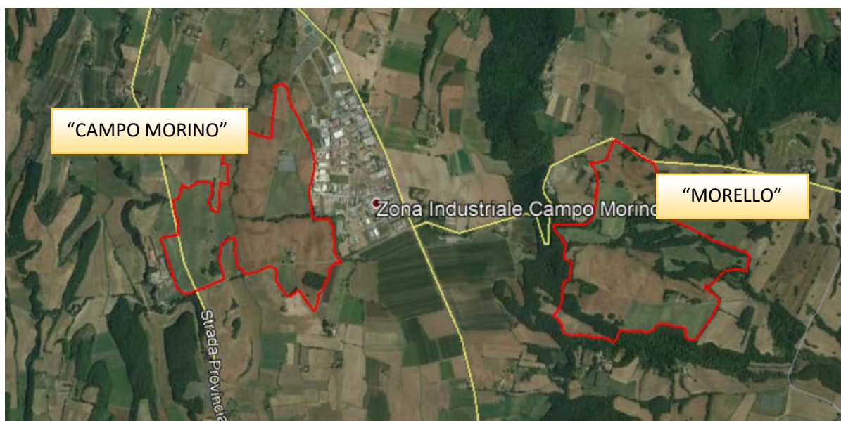
Fig. 1: vista satellitare delle macro aree impianto

Per ridurre i tempi delle opere si ritiene necessario definire due cantieri che alimenteranno i sottocantieri rispettivamente delle piastre che costituiscono le macro aree.