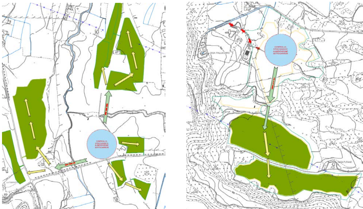
Fig.2- Schema concettuale dislocazione cantieri e alimentazione sottocantieri

I mezzi di trasporto merci accederanno ai lotti adibiti alla ricezione dei materiali. Dopo aver superato i controlli di sicurezza ed effettuata la registrazione dei documenti di trasporto, verrà organizzato lo scarico dei materiali e la movimentazione che sarà effettuata tramite mezzi controbilanciati e transpallet elettrici.