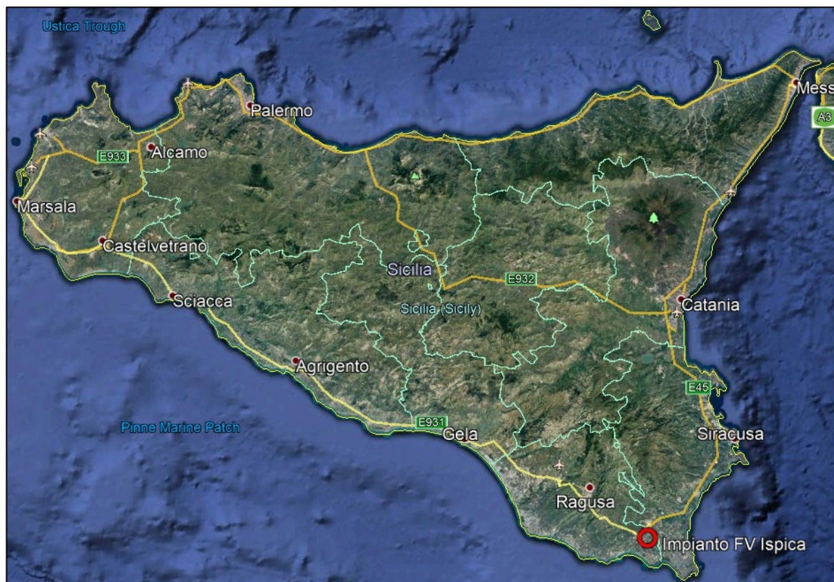
Figura 1 Localizzazione su immagine satellitare

Il nuovo impianto fotovoltaico insisterà, così come accennato precedentemente, su dei lotti di terreno ricadenti nel territorio comunale di Ispica nella provincia di Ragusa e Noto provincia di Siracusa, “ Premisi, Moltisanti, Modica, Miucia, Saia Baroni, Bufaleffi Di Sopra, Miucia, Carruba-Bombiscuro, Bonivini, Cozzo Pelato, Agliastro, Tasca, Coste Fredde, Staiano ”.