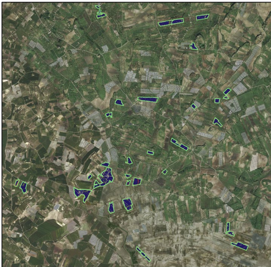
Figura 2 : Inquadramento impianto su ortofoto

La sottostazione elettrica di connessione ricade invece nel territorio del Comune di Ragusa ubicata in prossimità della SE "Ragusa" di competenza Terna.