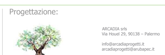
Tavola: CV. 3.1

Titolo: RS06PD0007A0 PLANIMETRIA IMPIANTO SU CATASTALE