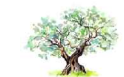
Tavola: CV. 3.4 Progettazione:

ARCADIA srl Via Houel 25, 90138 - Palermo info@arcadiaprogetti.it arcadiaprogetti@arubapec.it