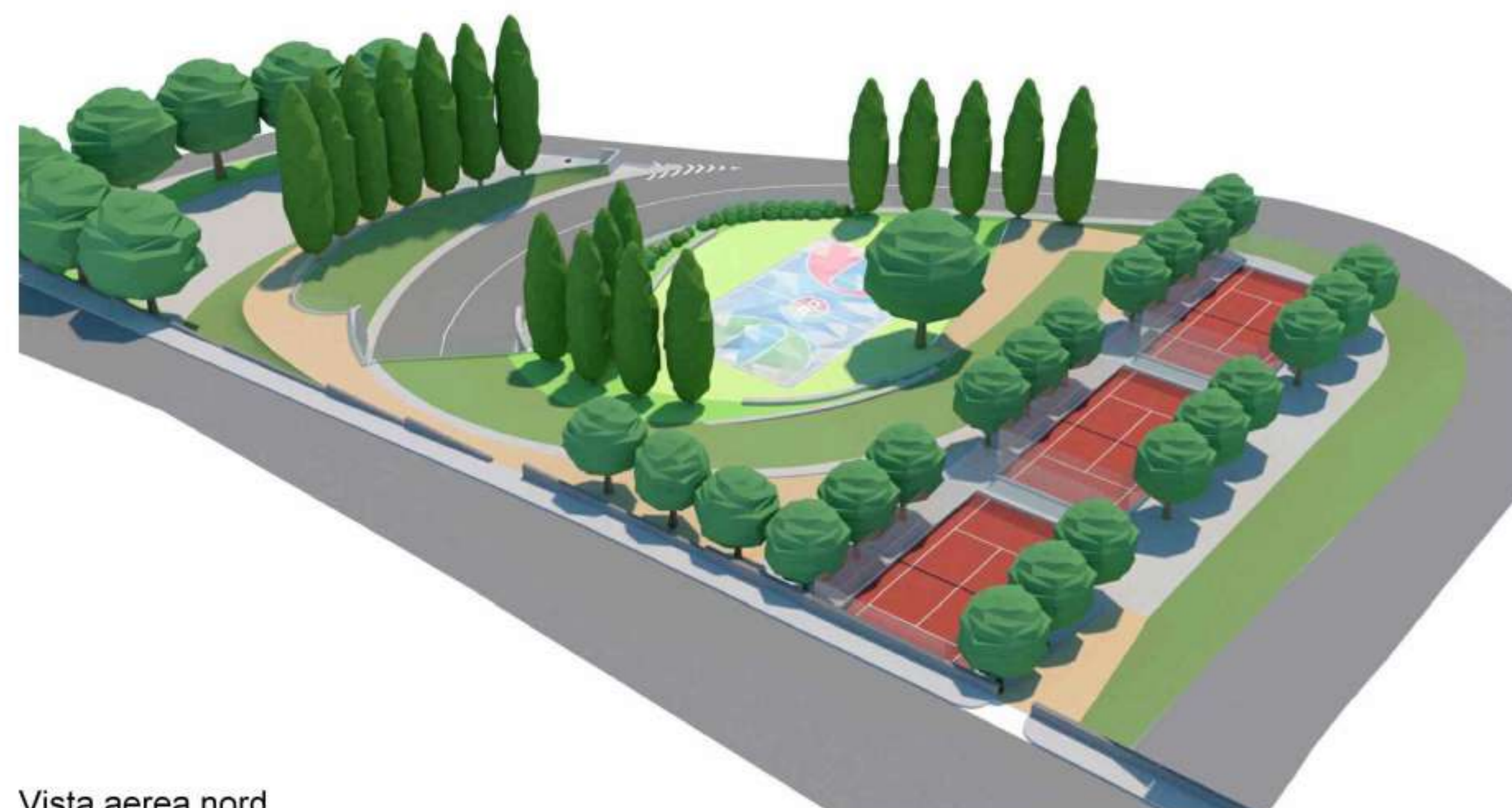
Vista aerea nord