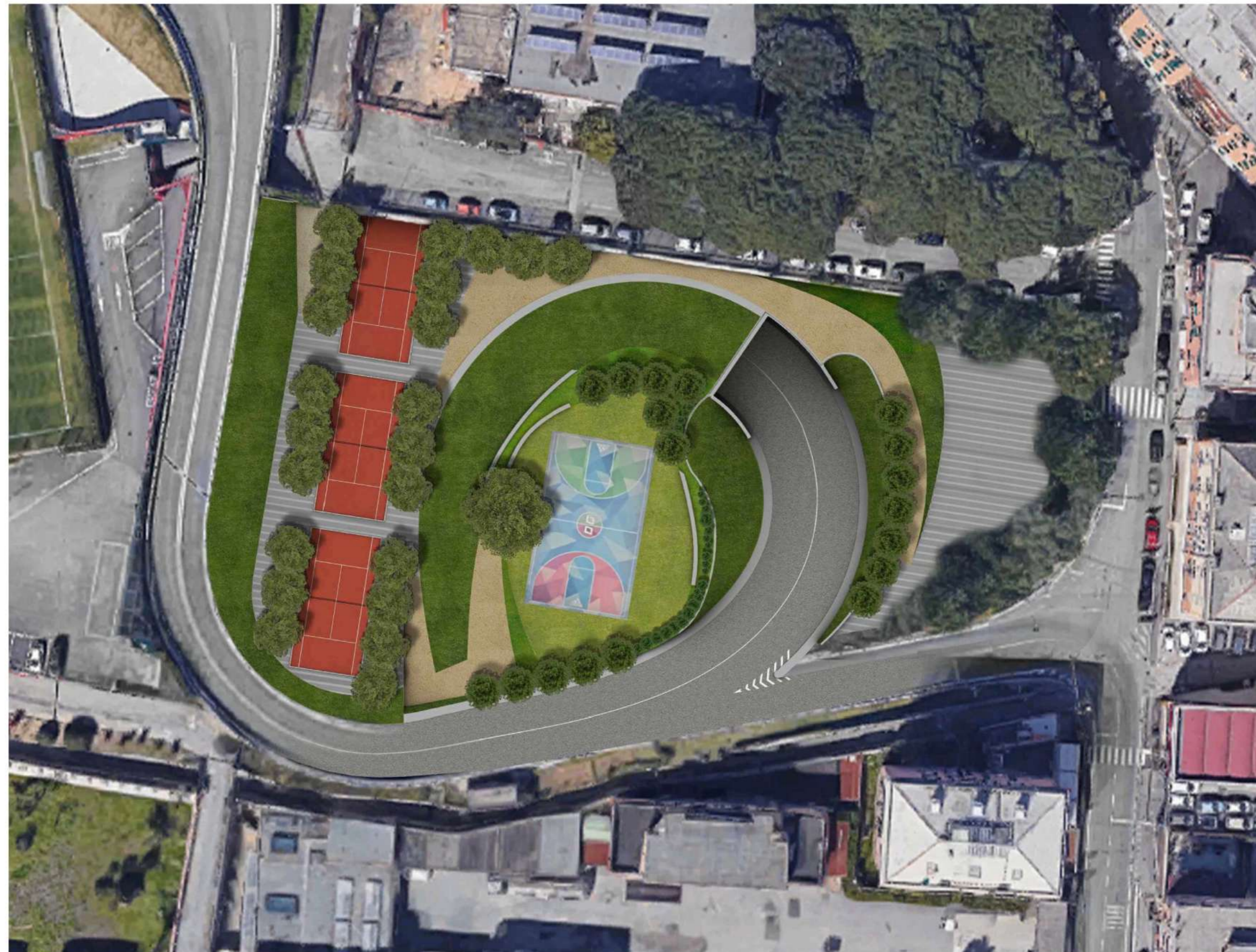
Fotoinserimento su immagine aerea zenitale area nord