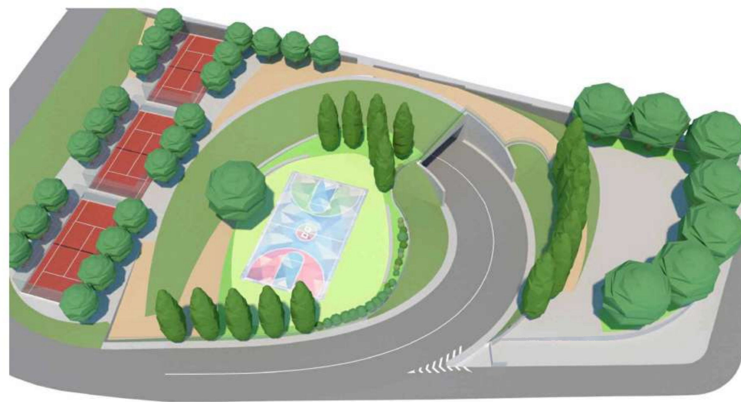
Vista aerea sud