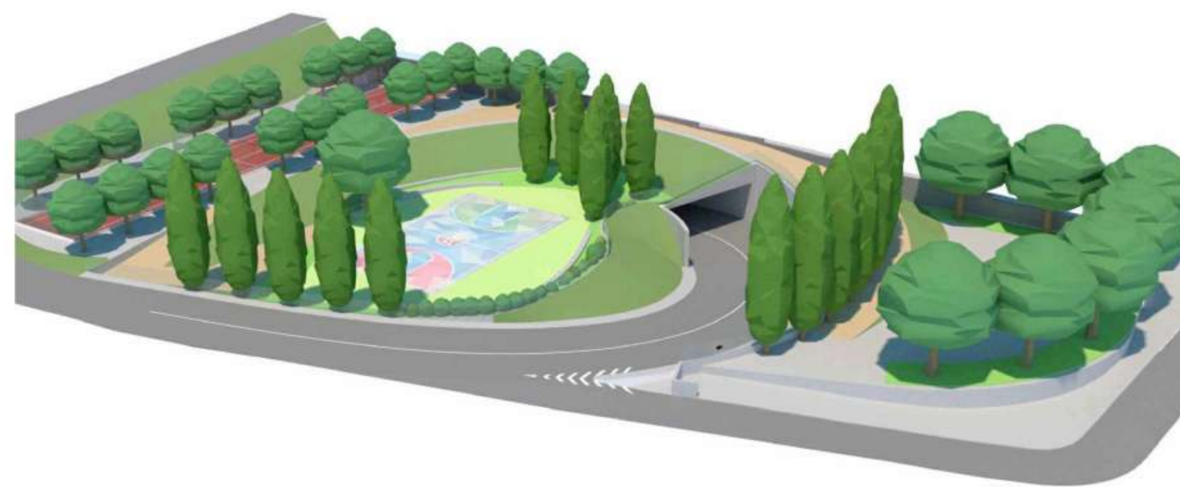
Vista aerea sud-est