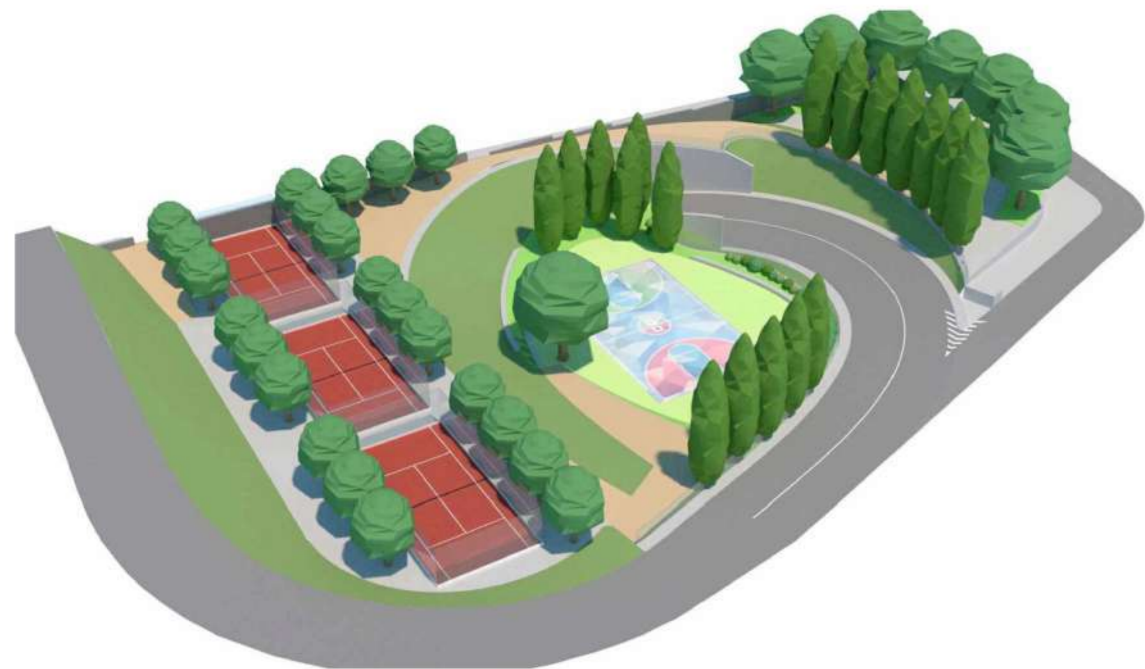
Vista aerea sud-ovest