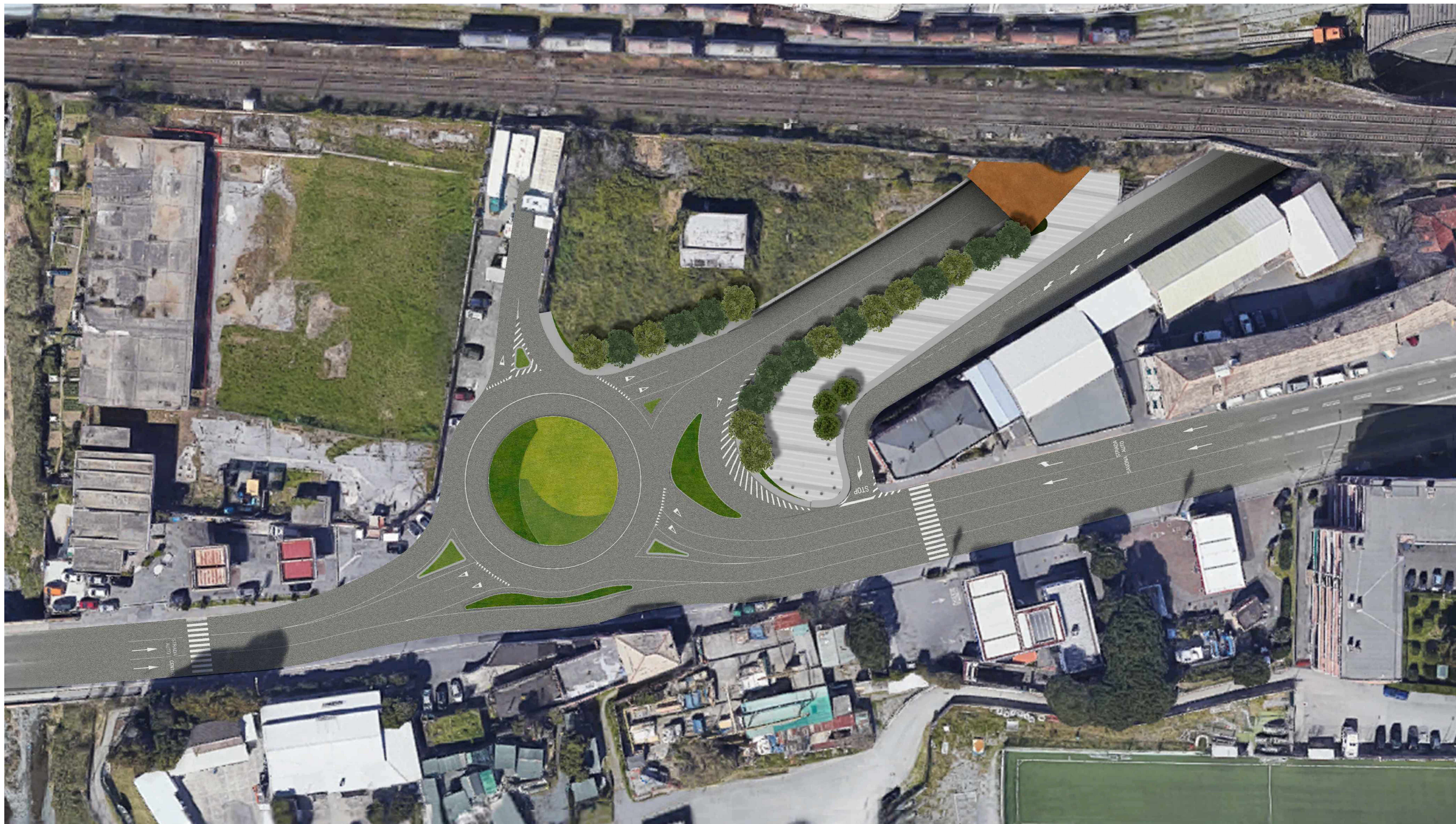
Fotoinserimento su immagine aerea zenitale area sud