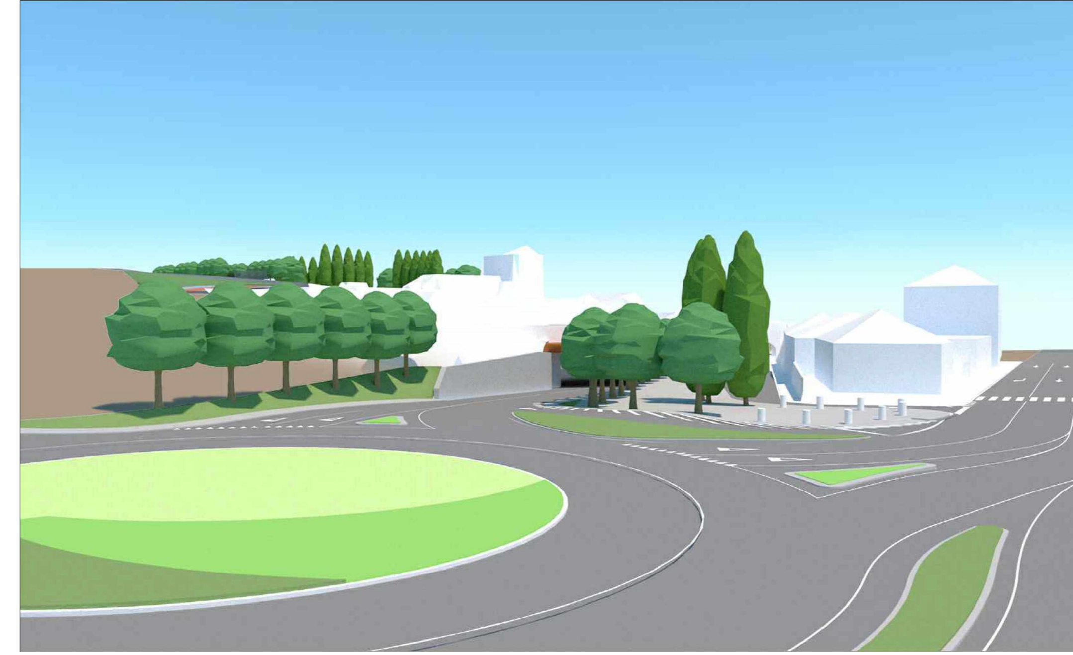
Vista livello strada sud-ovest