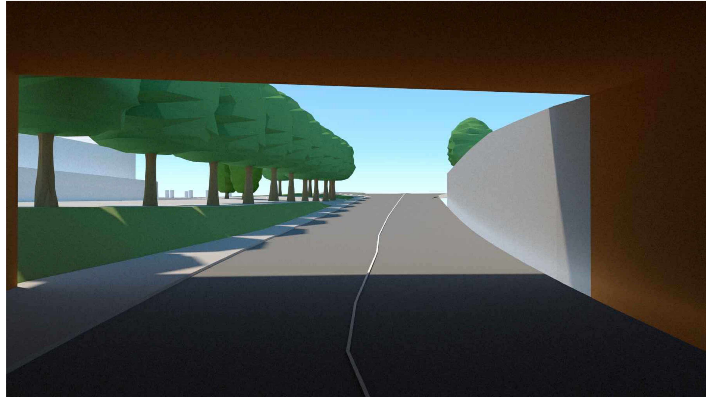
Vista livello strada - uscita da galleria