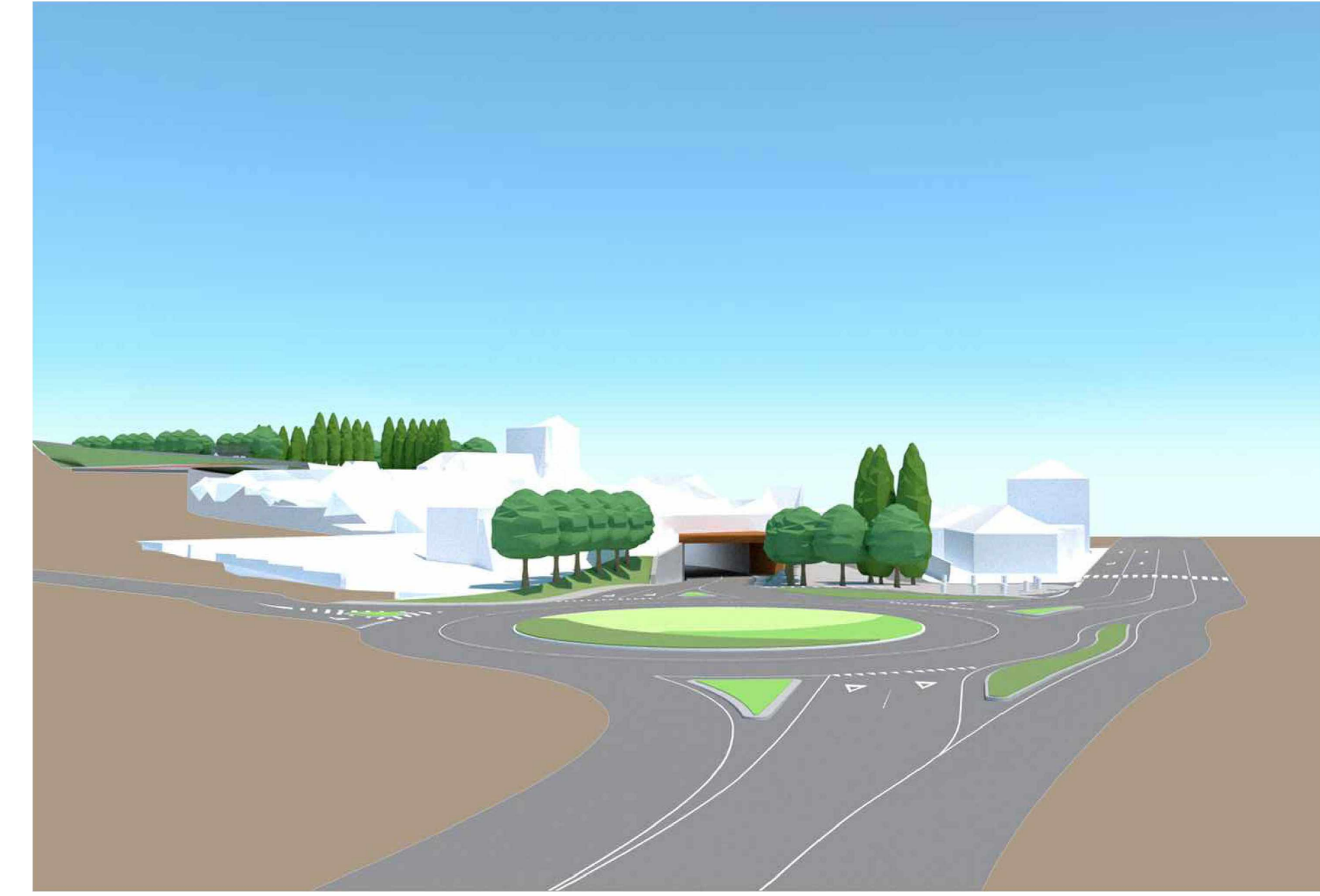
Vista aerea sud-ovest