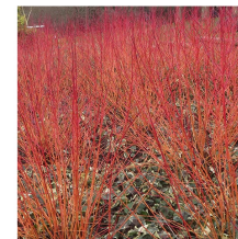
Cornus sanguinea Sanguinello