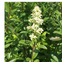
Ligustrum vulgare Ligustro