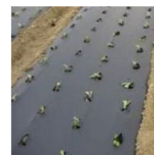
Telo pacciamante biodegradabile Larghezza: 2 m