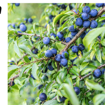
Prunus spinosa Prugnolo