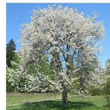
Prunus avium Ciliegio selvatico