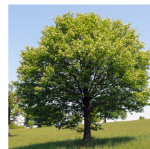
Acer campestre Acer campestre