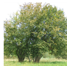
Corylus avellana Nocciolo