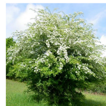
Crataegus monogyna Biancospino