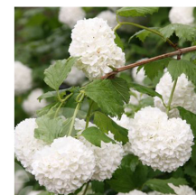
Viburnum opulus Viburno, palle di neve