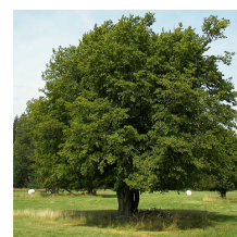
Carpinus betulus Carpino bianco