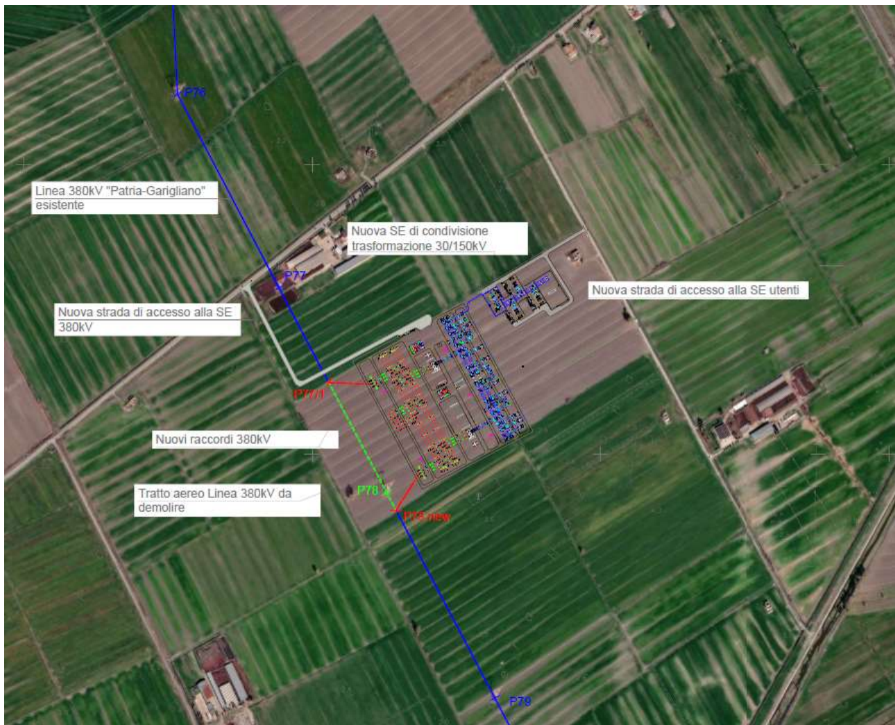
Figure 1: Ortofoto della nuova SE RTN 380/150 kV (a sinistra) e SE di condivisione/trasformazione 30/150 kV

Il comune interessato alla realizzazione della stazione elettrica è Canello ed Arnone in provincia di Caserta località Pantano.