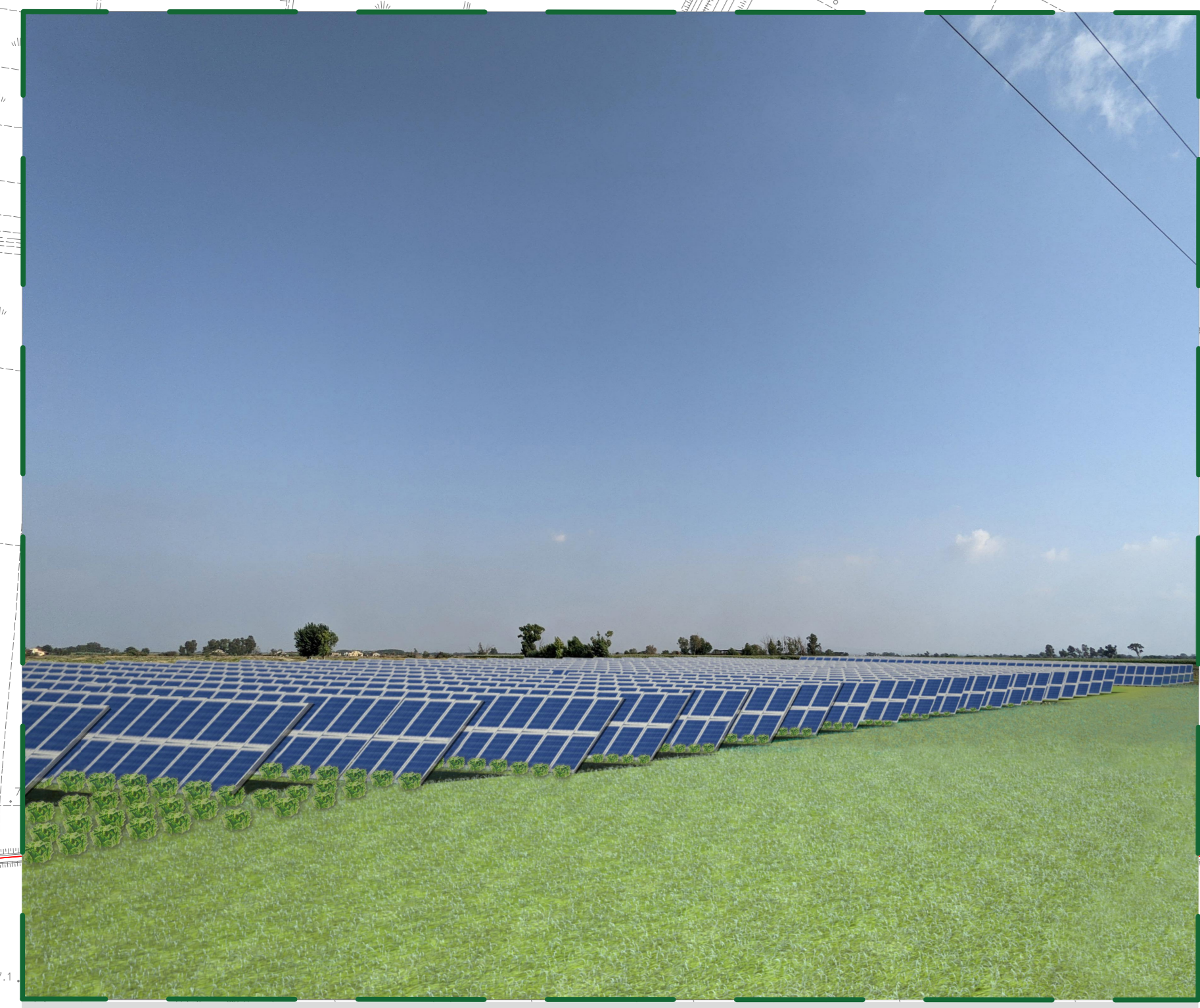
Superficie utilizzabile ai fini agricoli