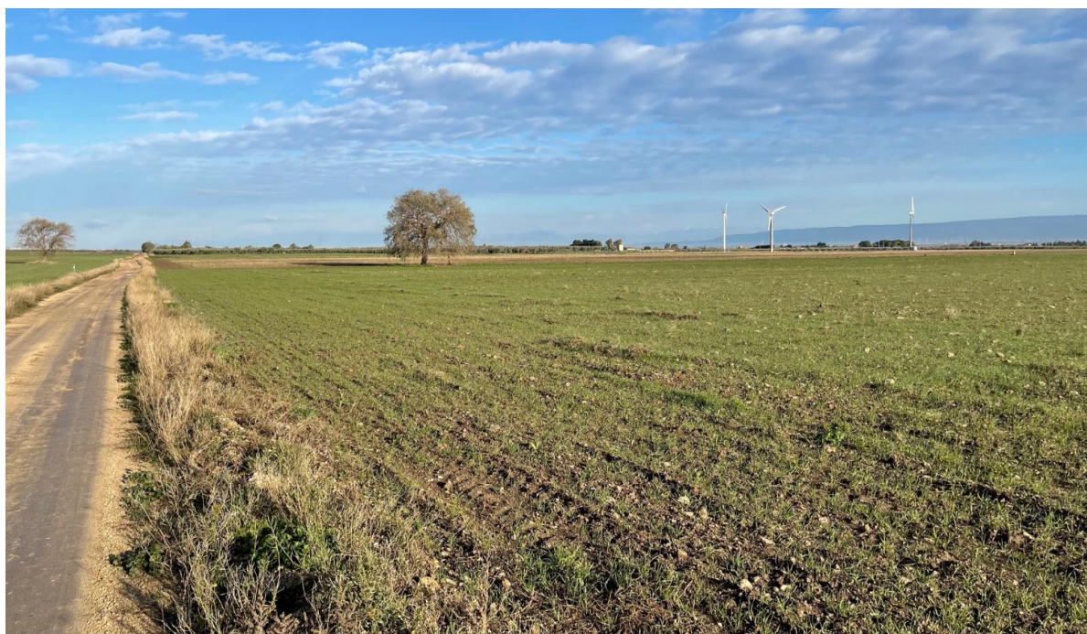
Fig. 2 - Particolare di coltivazioni agricole in atto

A fronte di quanto evidenziato, per la destinazione d'uso dei terreni in esame e il contesto in cui ricadono, si conferma l'assenza di strutture e di colture agricole che possano far presupporre l'esistenza di particolari tutele, vincoli o contratti con la pubblica