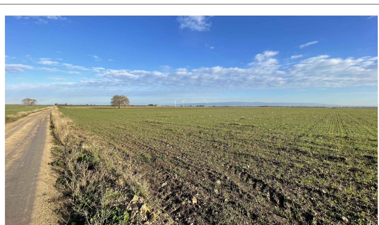
FOTOINSERIMENTO 1 - STATO DI FATTO