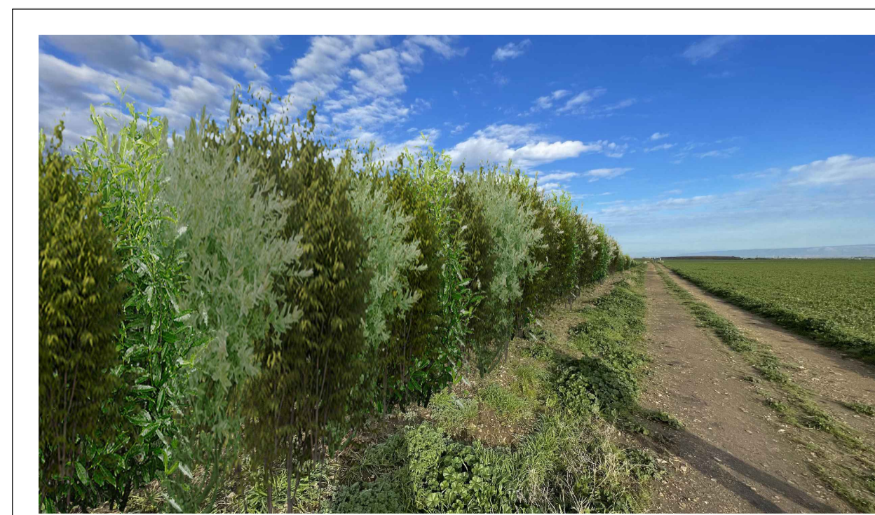
FOTOINSERIMENTO 3 - STATO DI PROGETTO