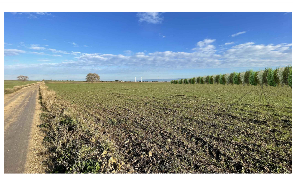
FOTOINSERIMENTO 1 - STATO DI PROGETTO