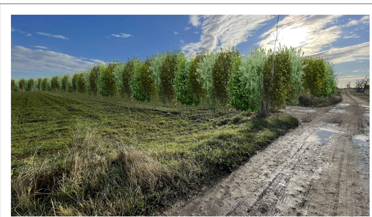
FOTOINSERIMENTO 2 - STATO DI PROGETTO