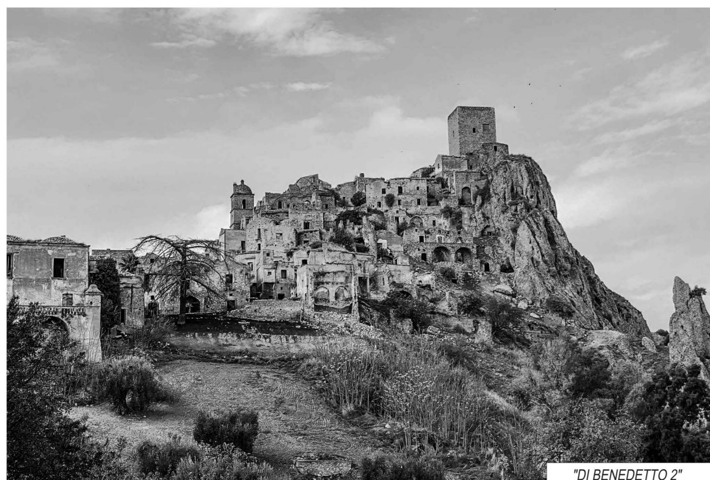
"DI BENEDETTO 2"