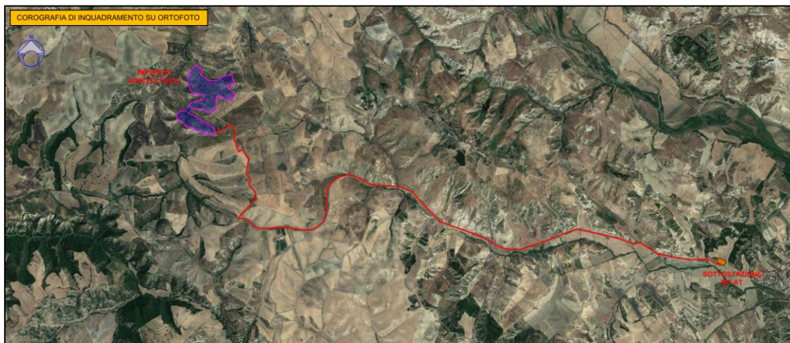
Figura 1 - Inquadramento su ortofoto dell'impianto (stralcio tavola A12a1-3)

Il sito di interesse è ubicato nel Comune di Craco (MT). Esso dista in linea d'aria circa 3,3 km circa dal centro abitato di "Craco Vecchia" a Sud-Est, 12,6 km circa dal centro abitato di Stigliano ad Ovest, 12,7 km circa da Ferrandina a Nord-Est e 12,7 km circa dal centro abitato di Pisticci ad Est.