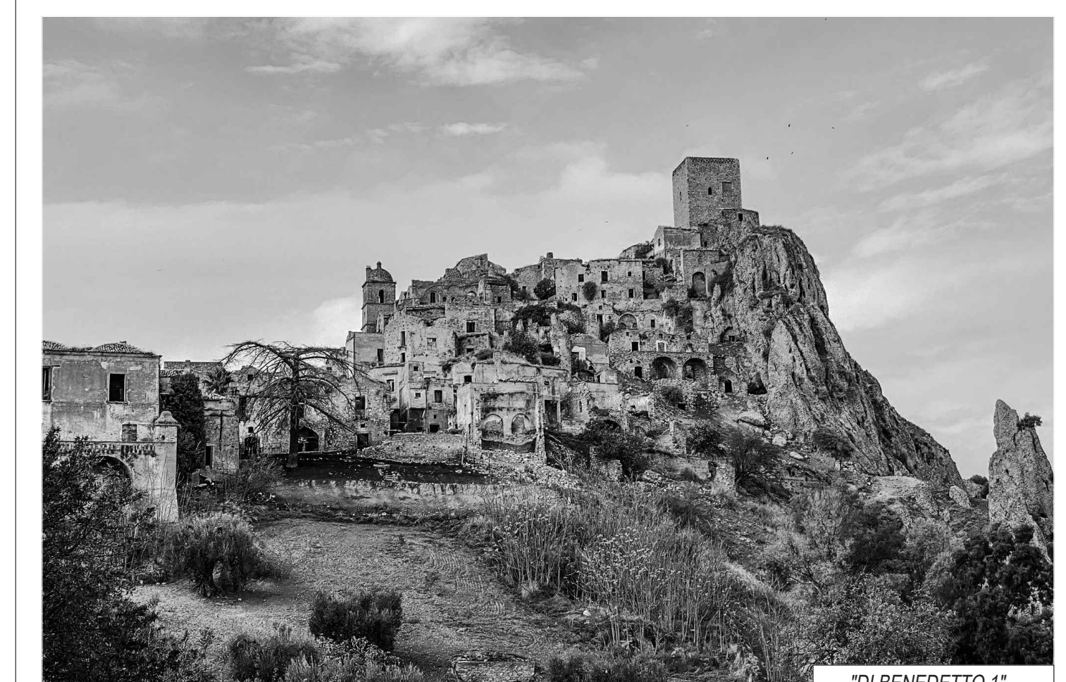
"DI BENEDETTO 1"