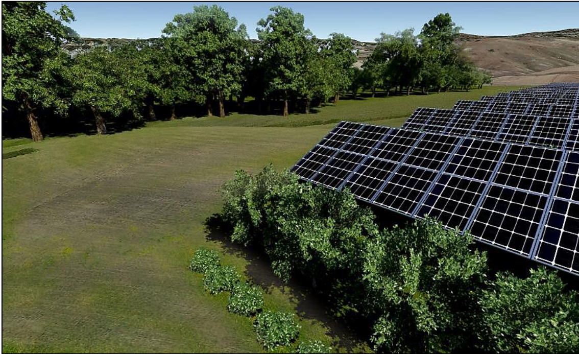
Figura 4 - Particolare delle misure di mitigazione sulla componente "paesaggio"

è possibile concludere che l'impianto sarà scarsamente e solo in minima parte visibile dai recettori considerati.