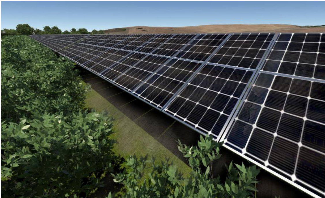
Figura 3 - Rendering di progetto

Dalle analisi qualitative e quantitative condotte nello SIA è emerso che l’impatto ambientale è del tipo trascurabile ad eccezione di alcuni parametri ed alcune fasi specifiche della vita dell’impianto (costruzione, esercizio e dismissione). Nello specifico la componente dell’impatto sull’ambiente ha valori diversi dal “trascurabile” ma comunque compresi nel limite di “minimo” o “moderato” per i seguenti fattori, relativi alle specifiche fasi: