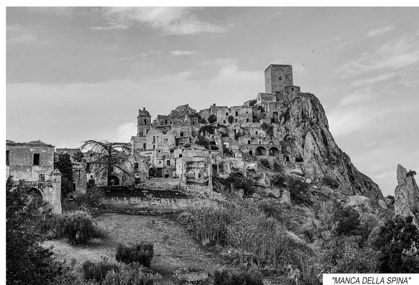
"MANCA DELLA SPINA"