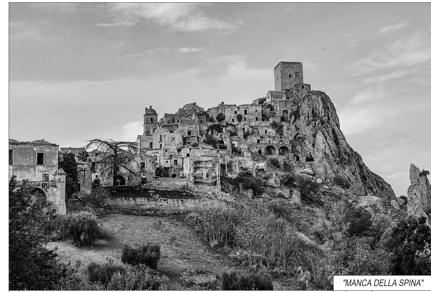
"MANCA DELLA SPINA"