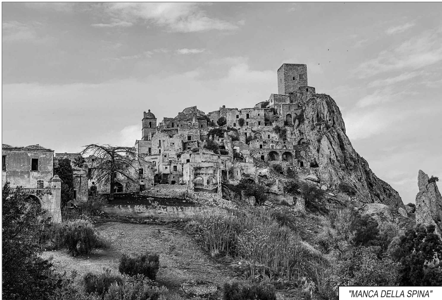
"MANCA DELLA SPINA"