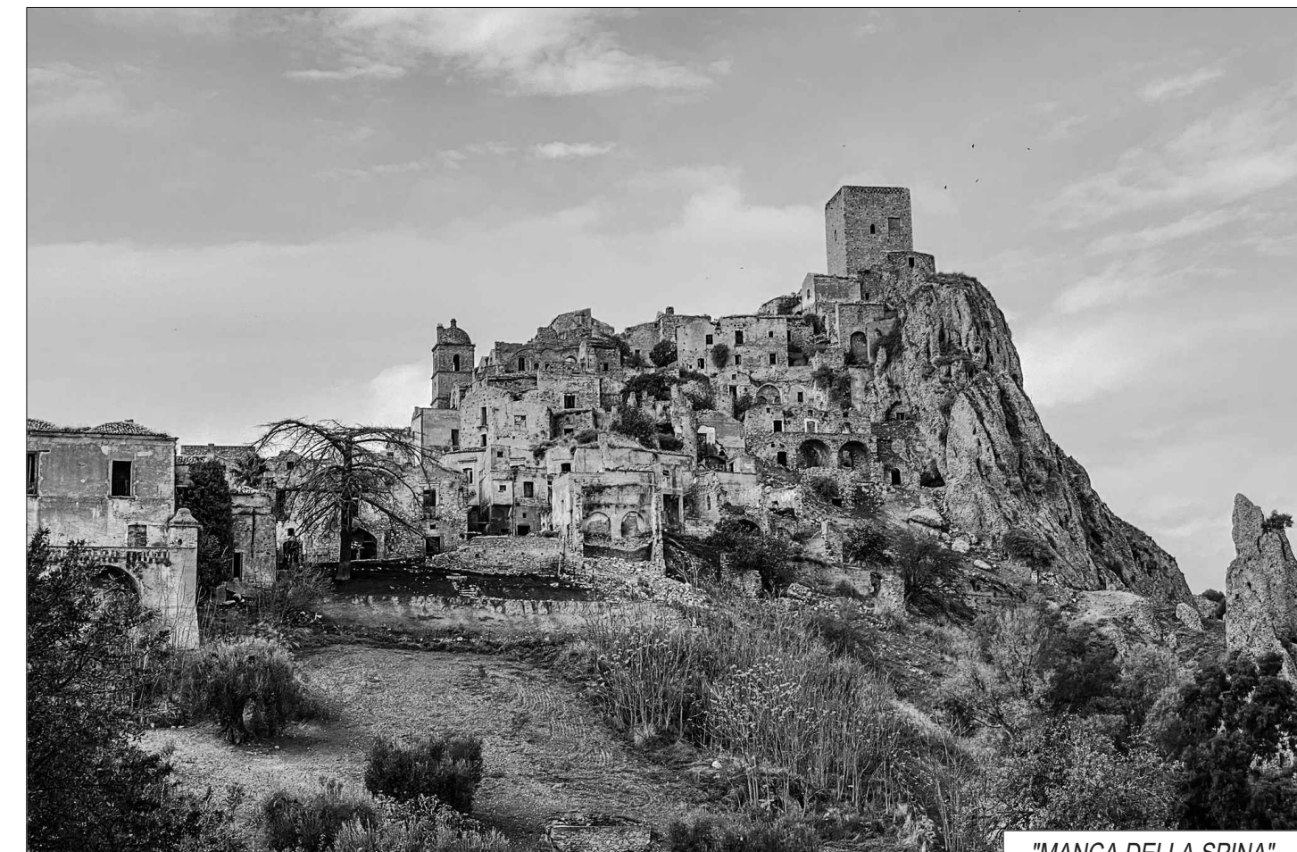
"MANCA DELLA SPINA"