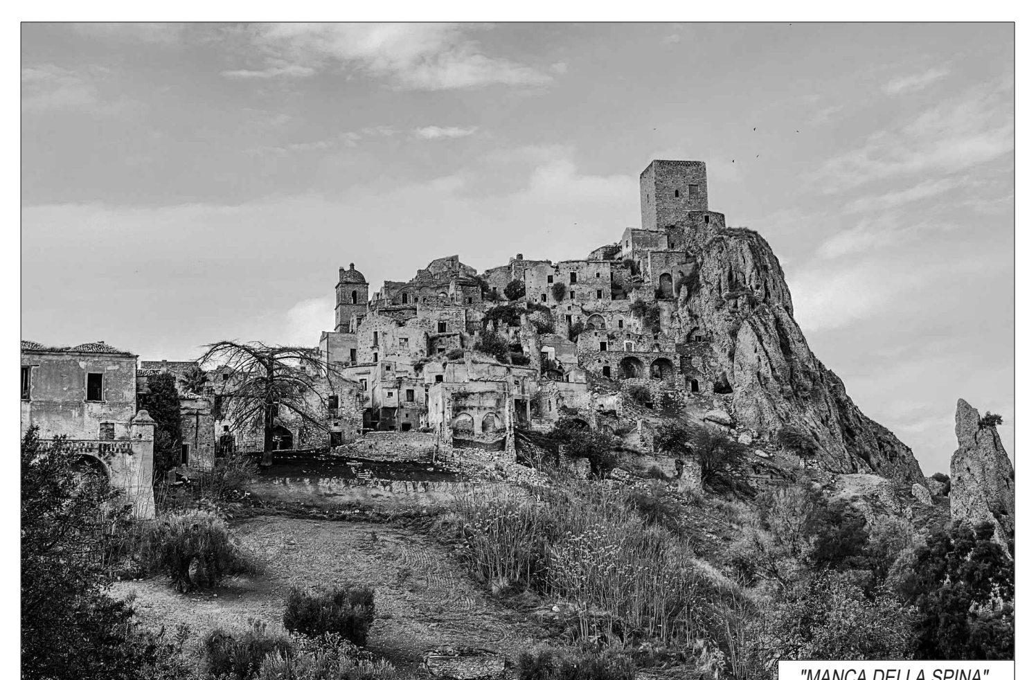
MANCA DELLA SPINA