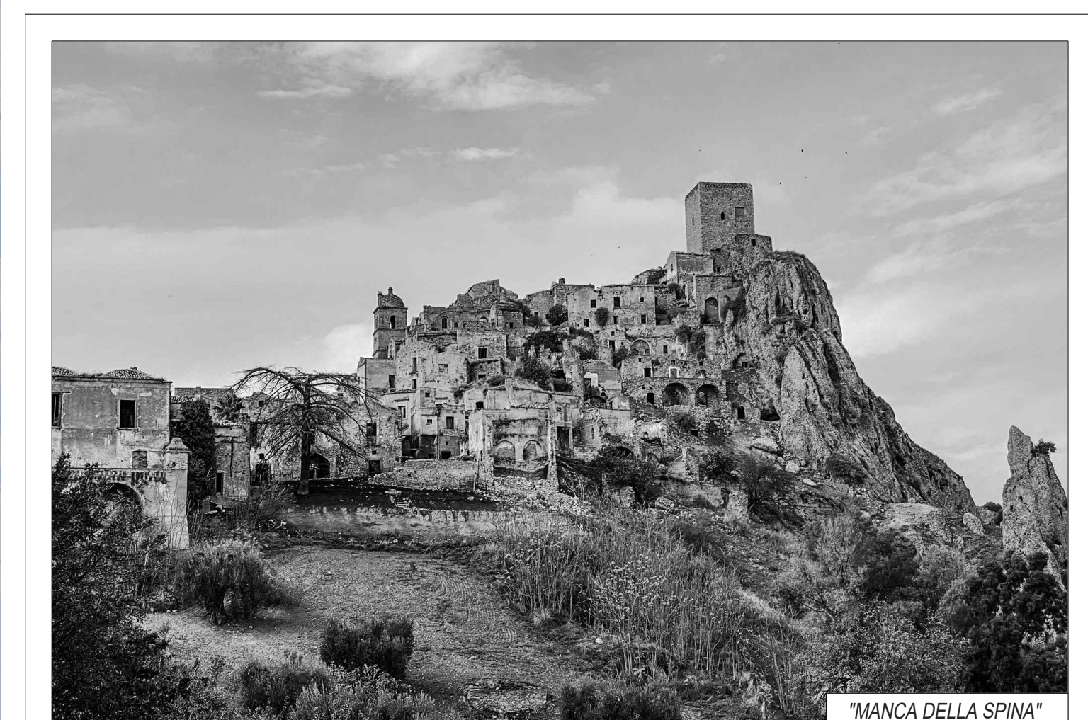
MANCA DELLA SPINA