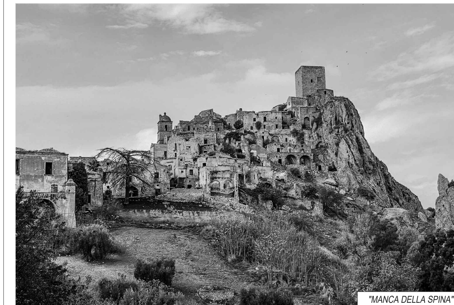
"MANCA DELLA SPINA"