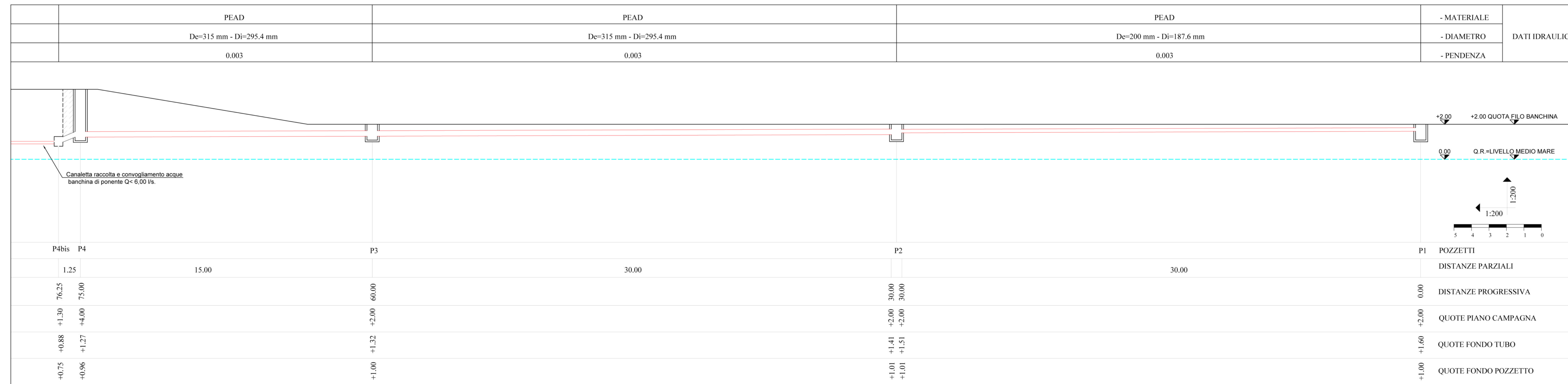
Planimetria collettore 1 - Scala 1:200