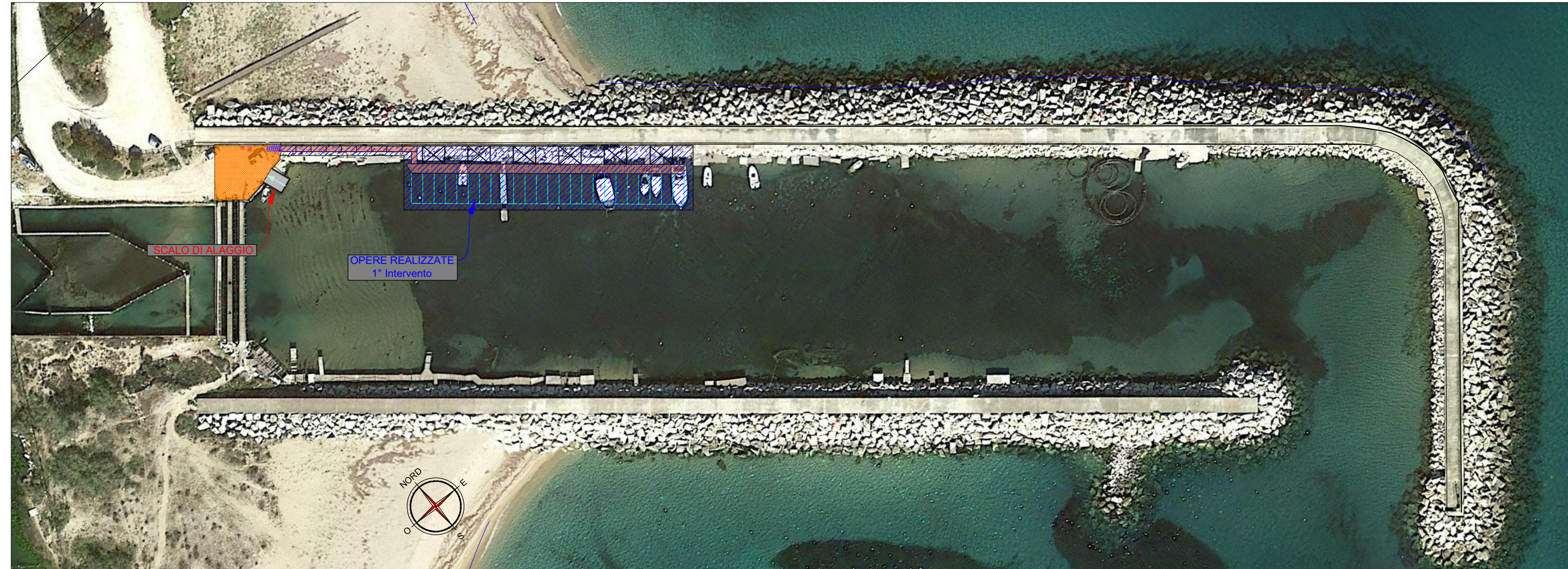
PLANIMETRIA DI PROGETTO_SCALA 1:200