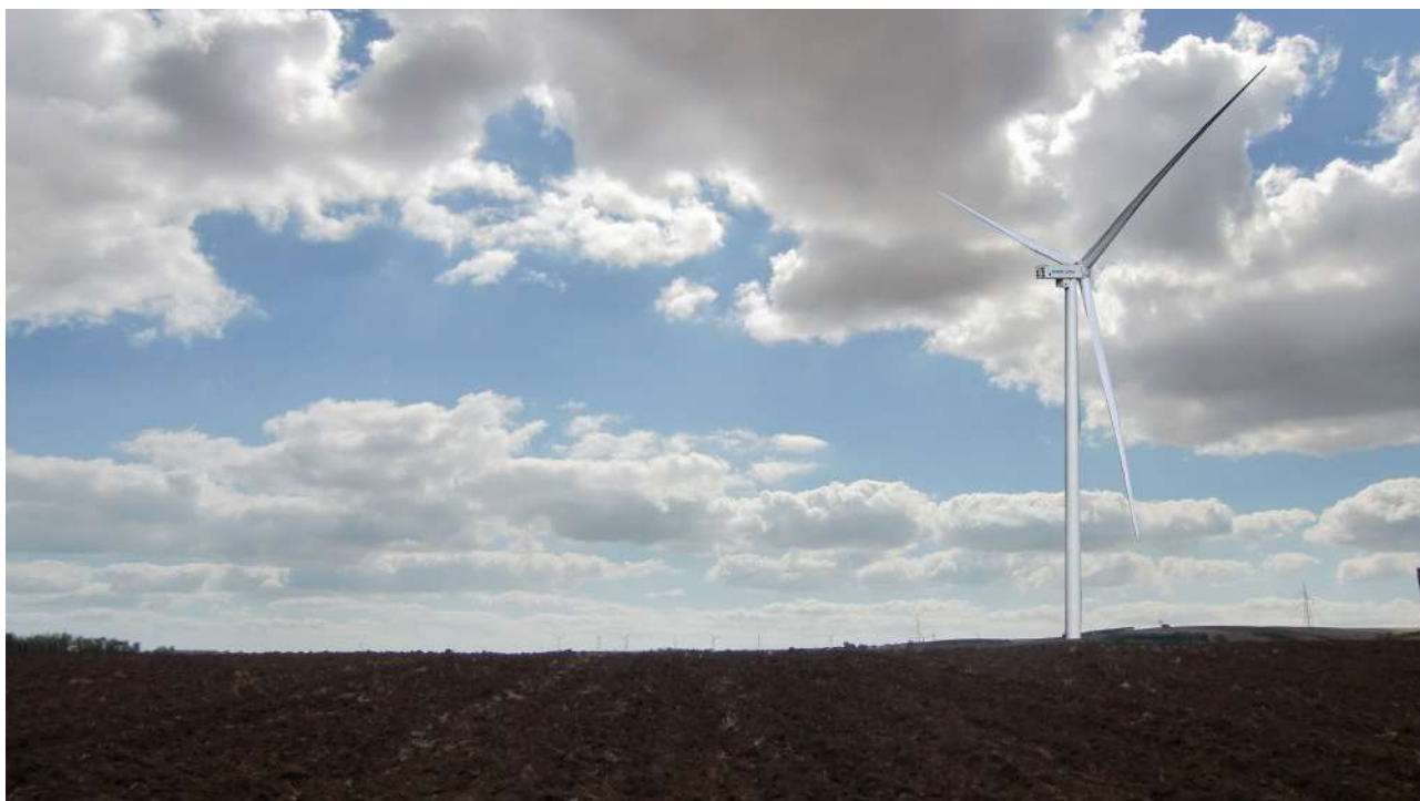
Punto 16 - fotoinserimento