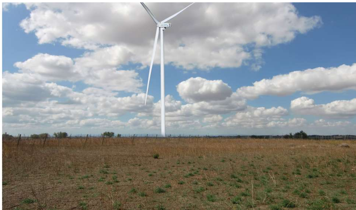
Punto 17 - fotoinserimento