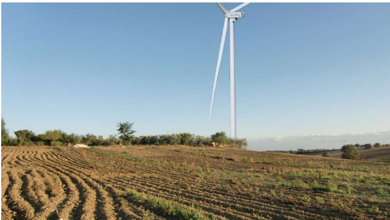
Punto 19 – Fotoinserimento