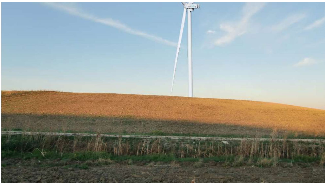
Punto 18 – fotoinserimento