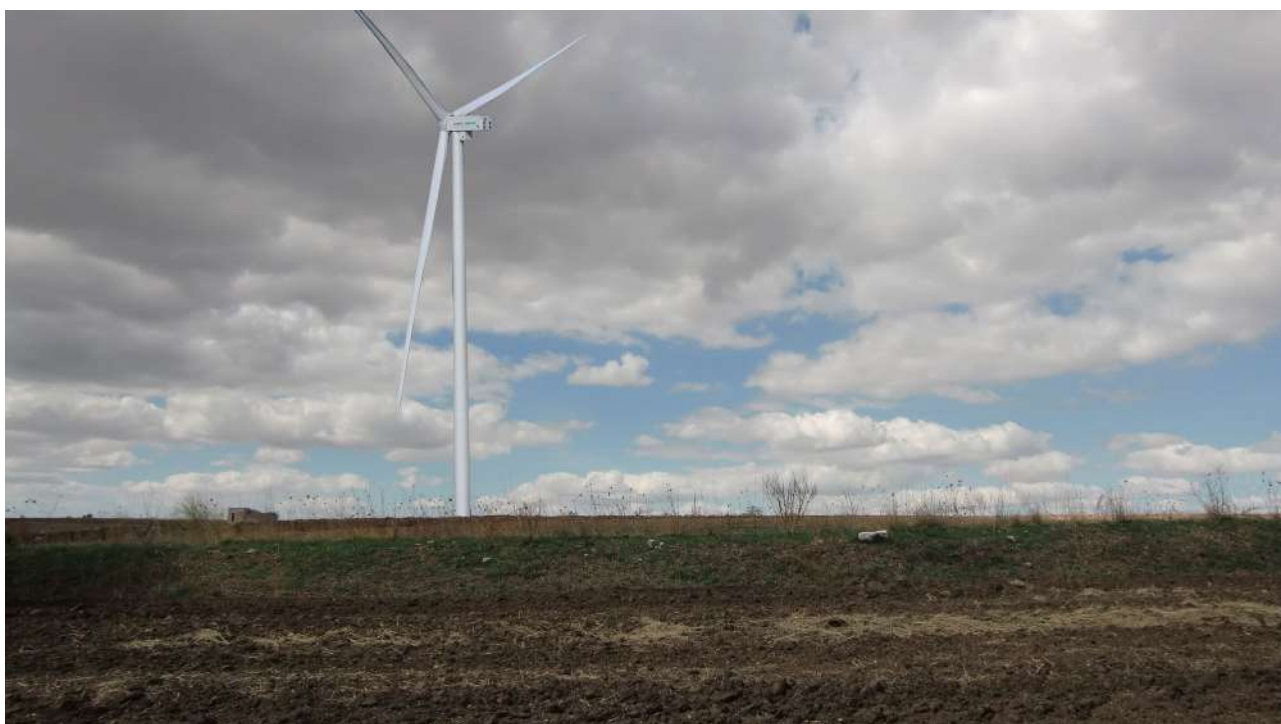
Punto 15 - fotoinserimento