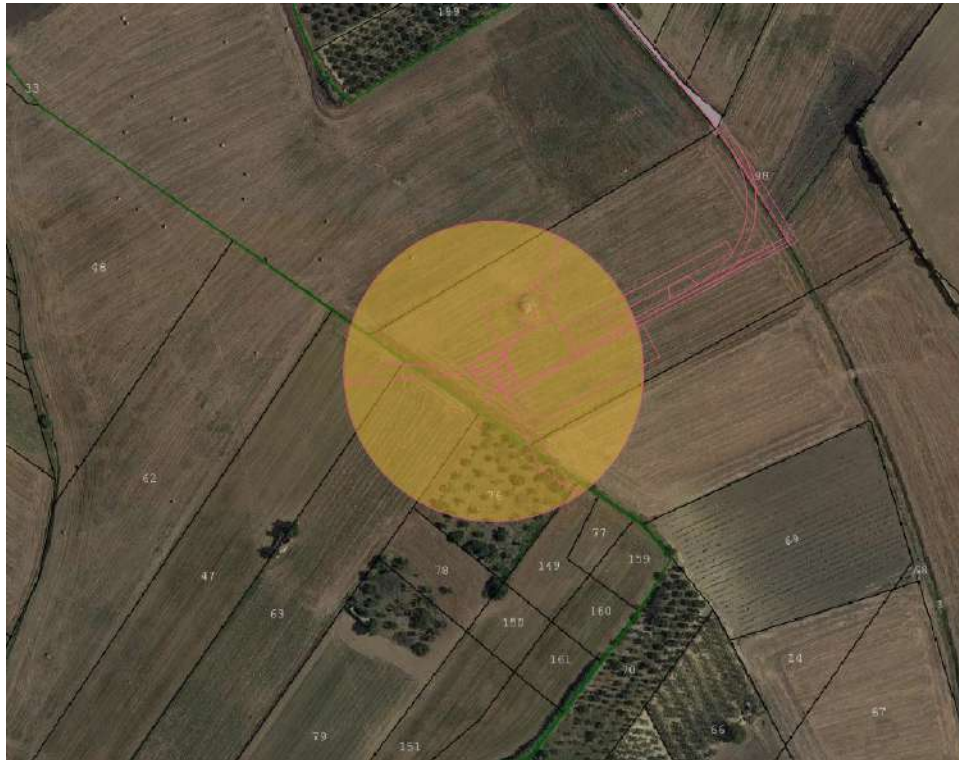
FIGURA 6 – Catasto-Ortofoto aerogeneratore WTG 5