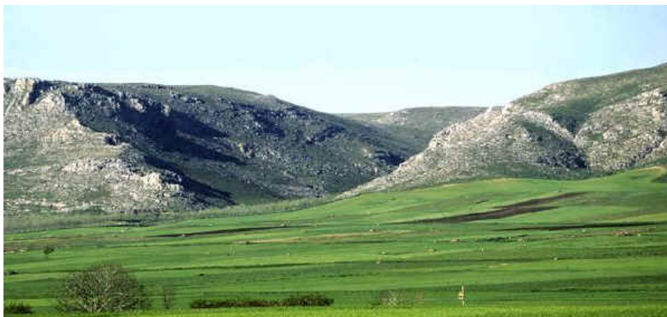
FIGURA 10 – Parco Nazionale dell'Alta Murgia