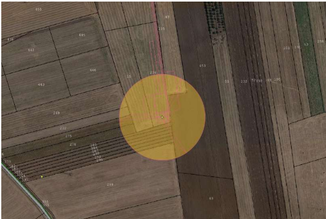
FIGURA 3 – Catasto-Ortofoto aerogeneratore WTG 2