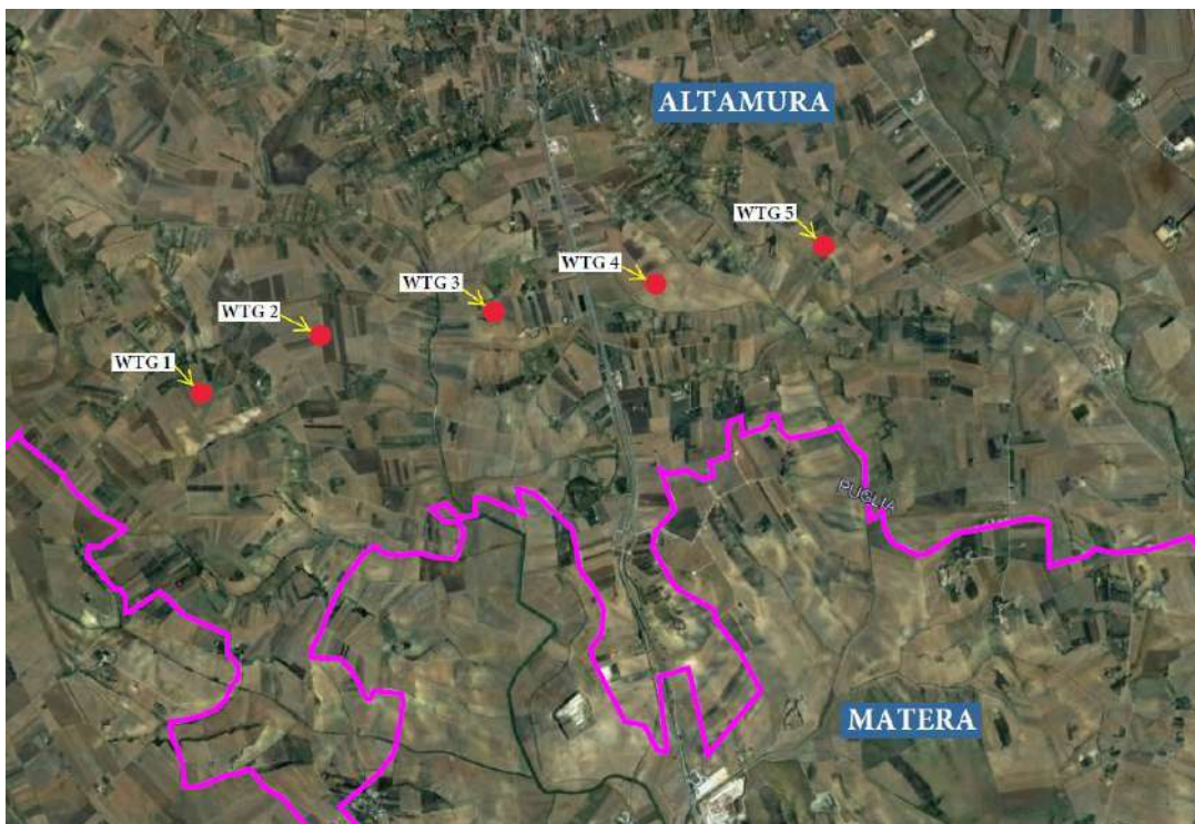
FIGURA 1 – Inquadramento territoriale parco eolico su base ortofoto

Il proposto parco eolico si colloca a circa 5,5 km dal principale centro abitato del Comune di Altamura, in direzione sud, e a circa 1,5 km dal confine con il Comune di Matera (Fig 1).