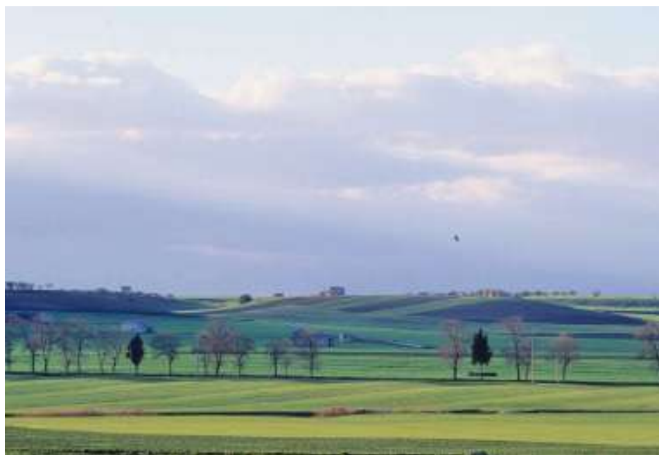
FIGURA 11 – Paesaggio della Fossa Bradanica