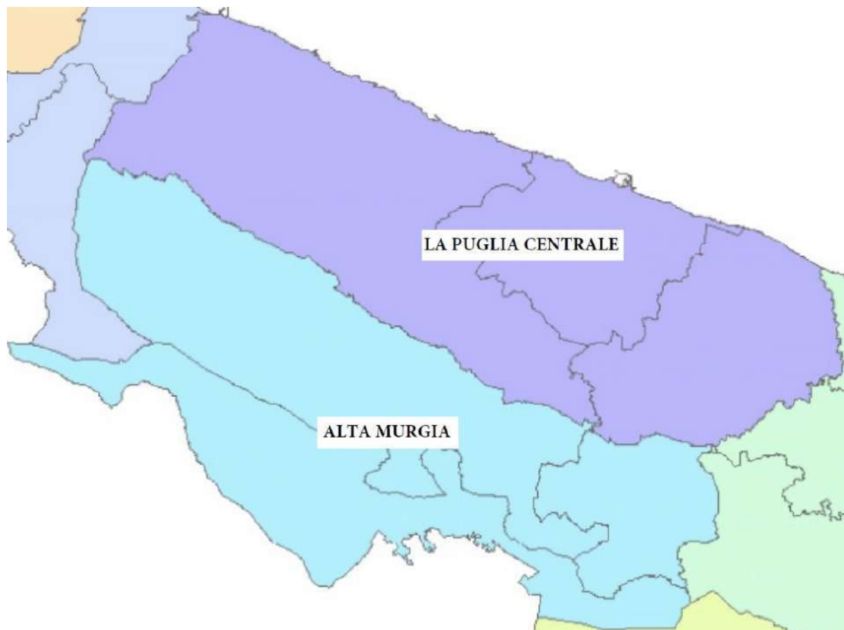
FIGURA 7 – Inquadramento dell'area vasta

Nel fronte nord-est dell'ambito, a causa della presenza di questo elemento morfologico fortemente caratterizzante dal punto di vista paesaggistico, per la definizione dei confini si è privilegiato il criterio orografico. Questa scelta ha comportato necessariamente la divisione delle superfici comunali a cavallo tra i due ambiti limitrofi (Alta Murgia e Puglia centrale), che sono testimonianza, invece, delle forti relazioni trasversali di sussistenza, da sempre esistite, fra l'interno e la costa (Fig. 7).