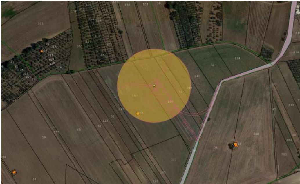
FIGURA 2 – Catasto-Ortofoto aerogeneratore WTG 1