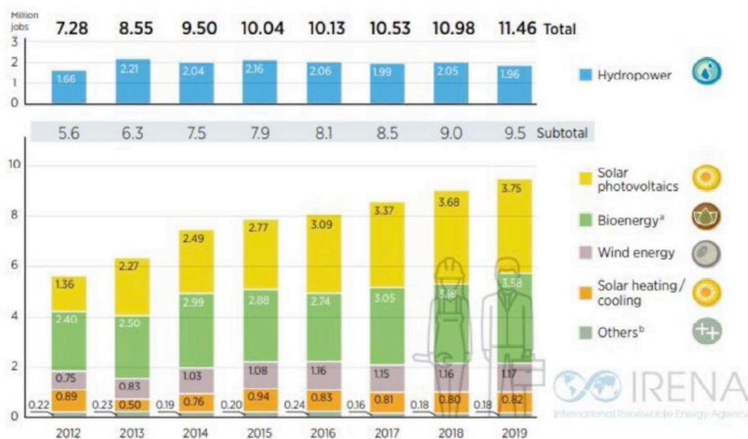
Dati occupazionali nel settore rinnovabile negli ultimi anni

Dal Rapporto emerge che sta cambiando lo scenario geografico del settore delle energie pulite con una diversificazione della filiera: se fino a poco tempo fa le industrie delle energie rinnovabili erano concentrate in pochi mercati importanti, come la Cina, gli Stati Uniti e Paesi come la Malesia, la Thailandia e il Vietnam sono stati responsabili di una maggiore percentuale di crescita dell'occupazione nel settore delle rinnovabili nel 2019, il che ha permesso all'asia di raggiungere una quota del 62 % di posti di lavoro nelle energie green in tutto il mondo (solo in Cina il 39%).