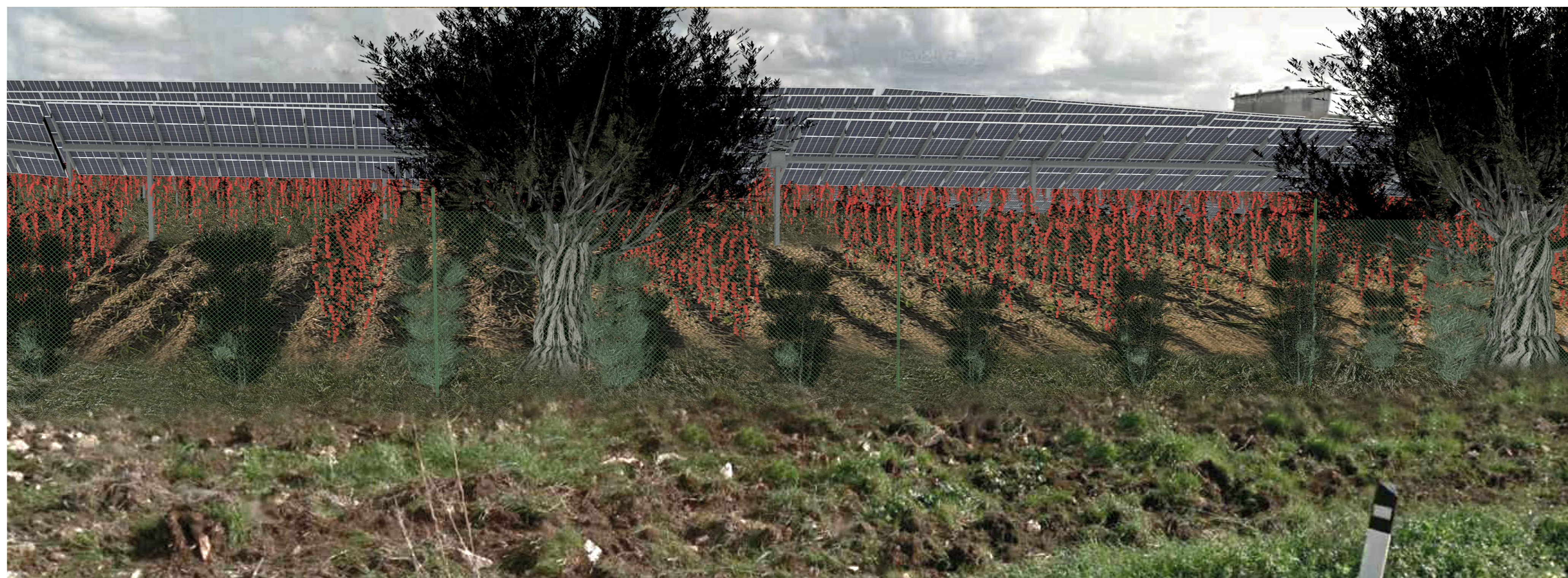
FOTO PUNTO DI VISTA 13 - POST OPERAM