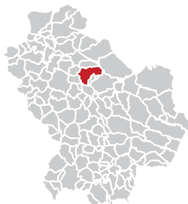
Ubicazione Comune di Tolve