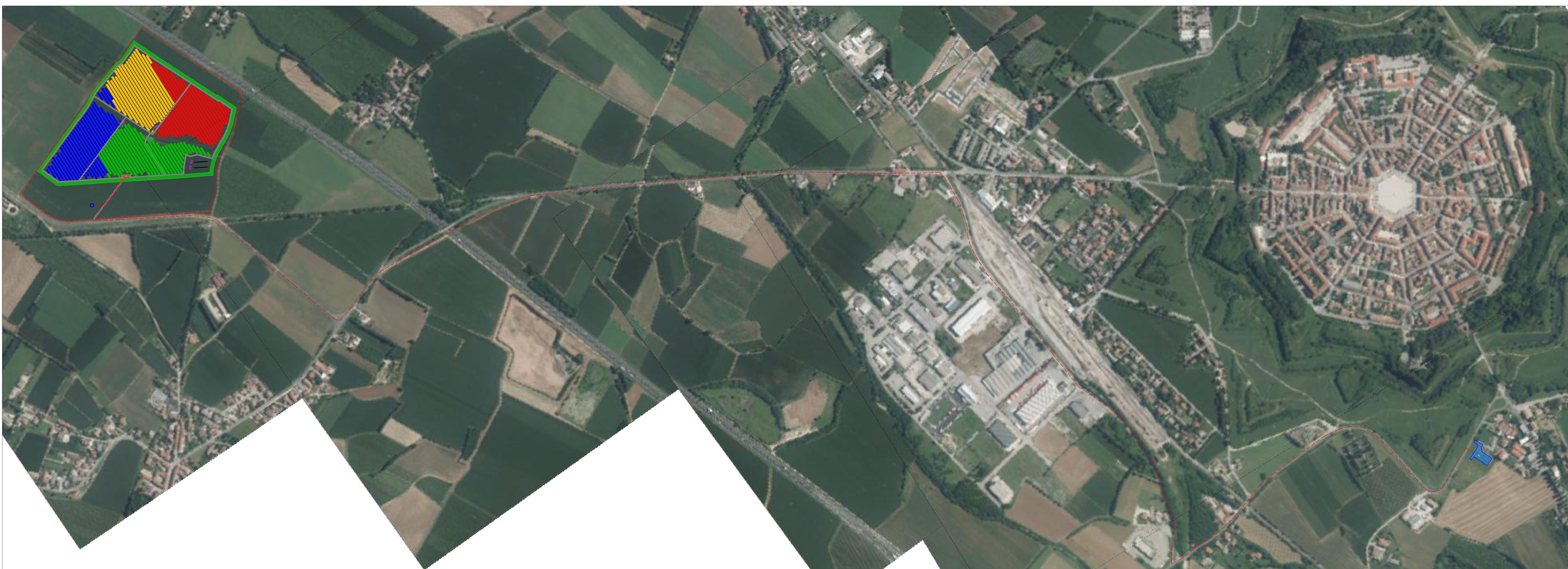
LOCALIZZAZIONE SU BASE ORTOFOTO - SCALA 1: 5.000