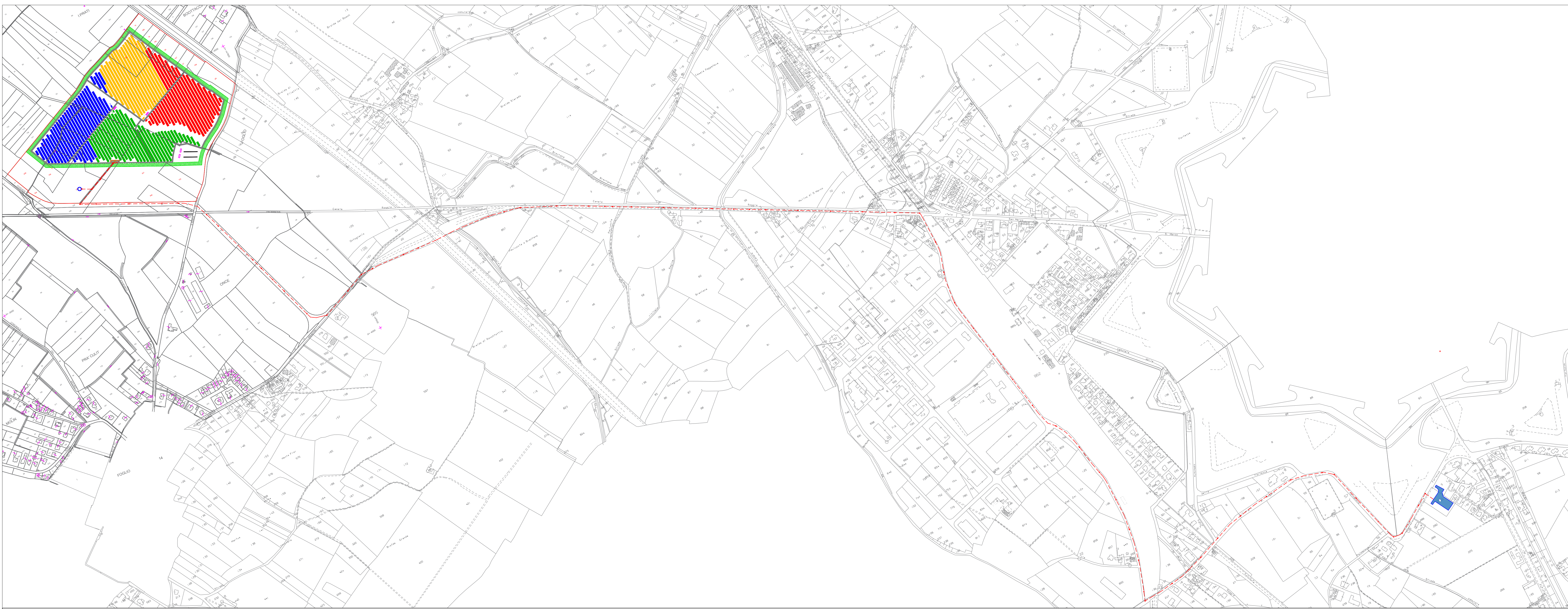
LOCALIZZAZIONE SU BASE CATASTALE - SCALA 1: 5.000