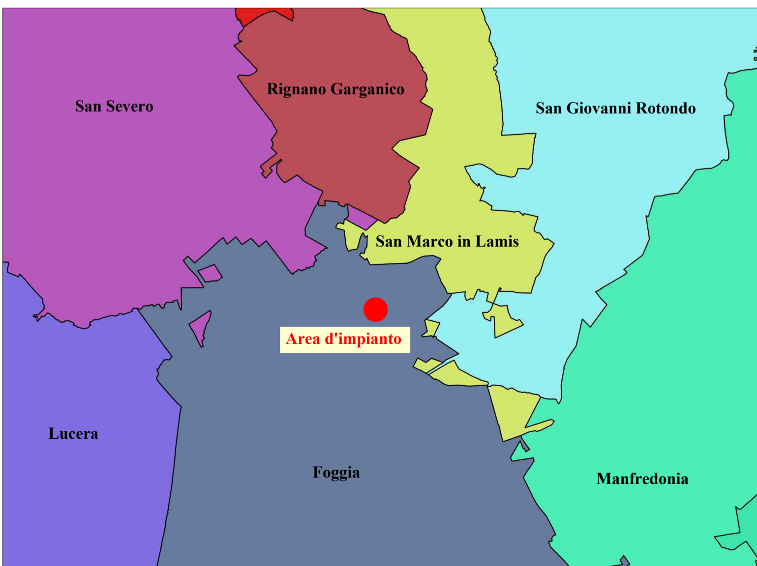
INQUADRAMENTO TERRITORIALE - SCALA 1:200.000