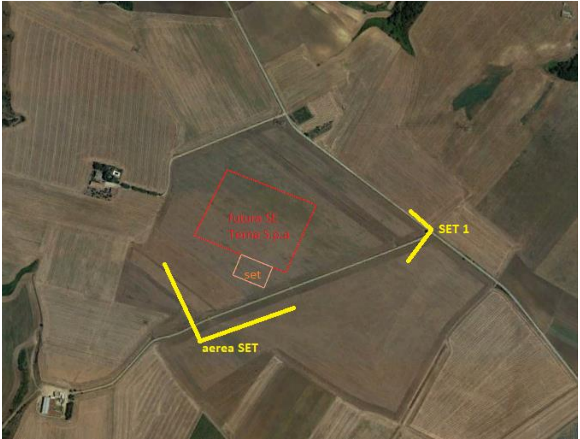
Punti di scatto area SET