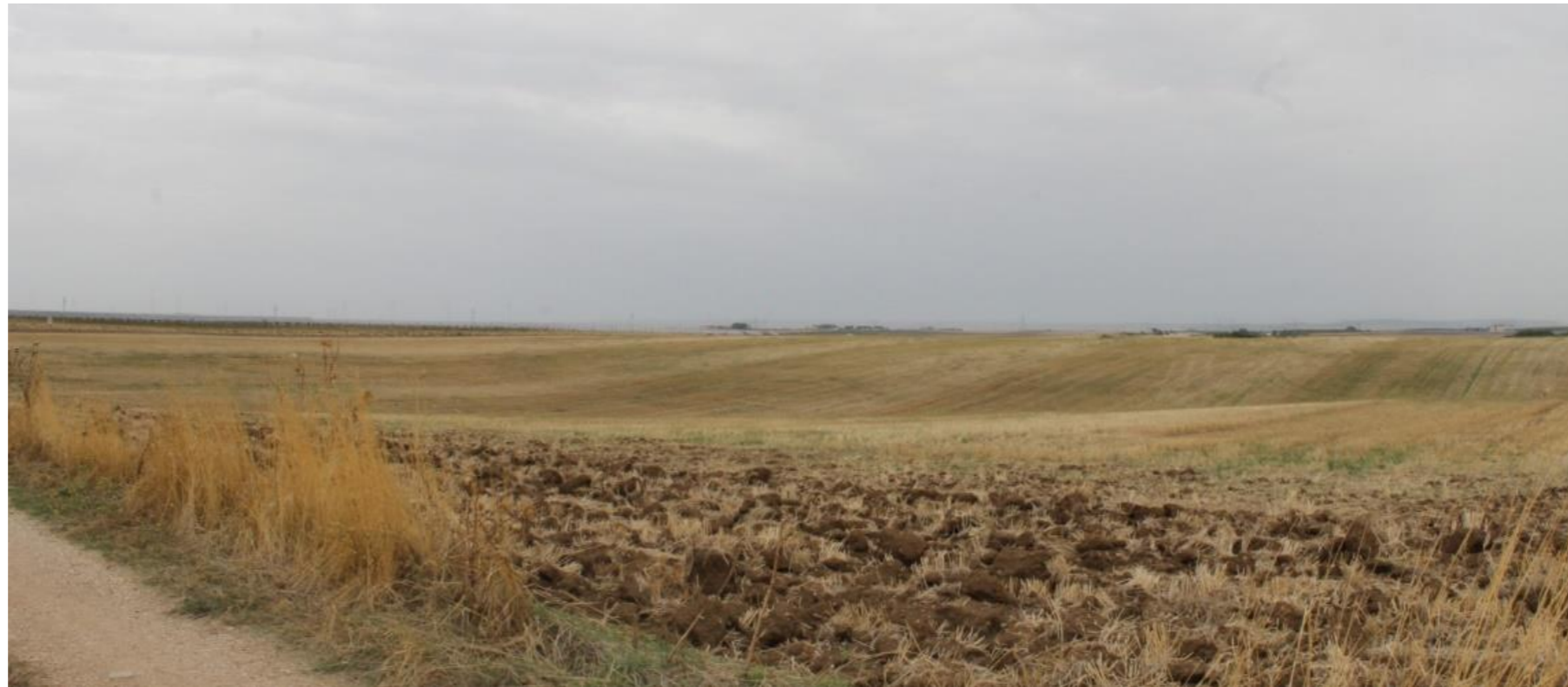
Punto di scatto 5– Stato di fatto