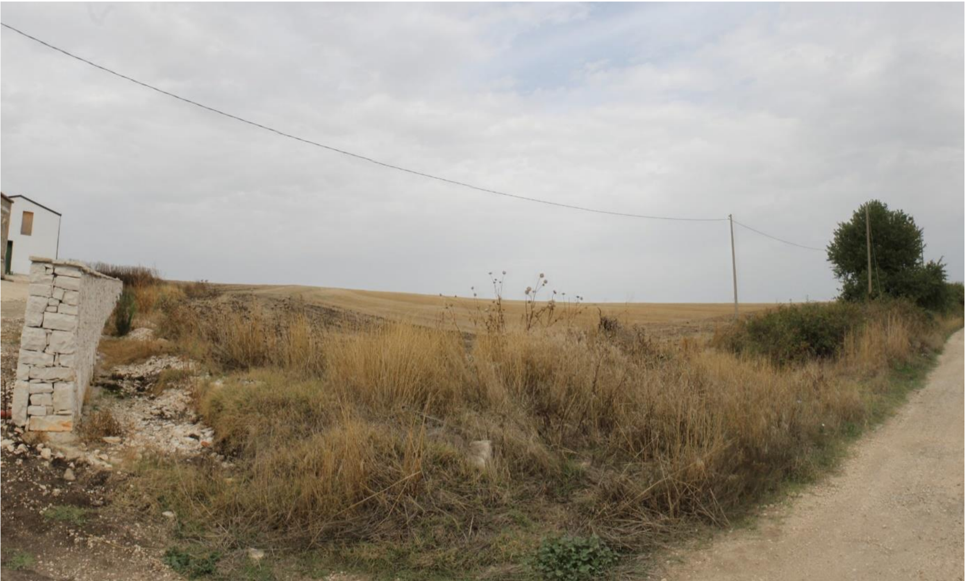
Punto di scatto 2 – Stato di Fatto