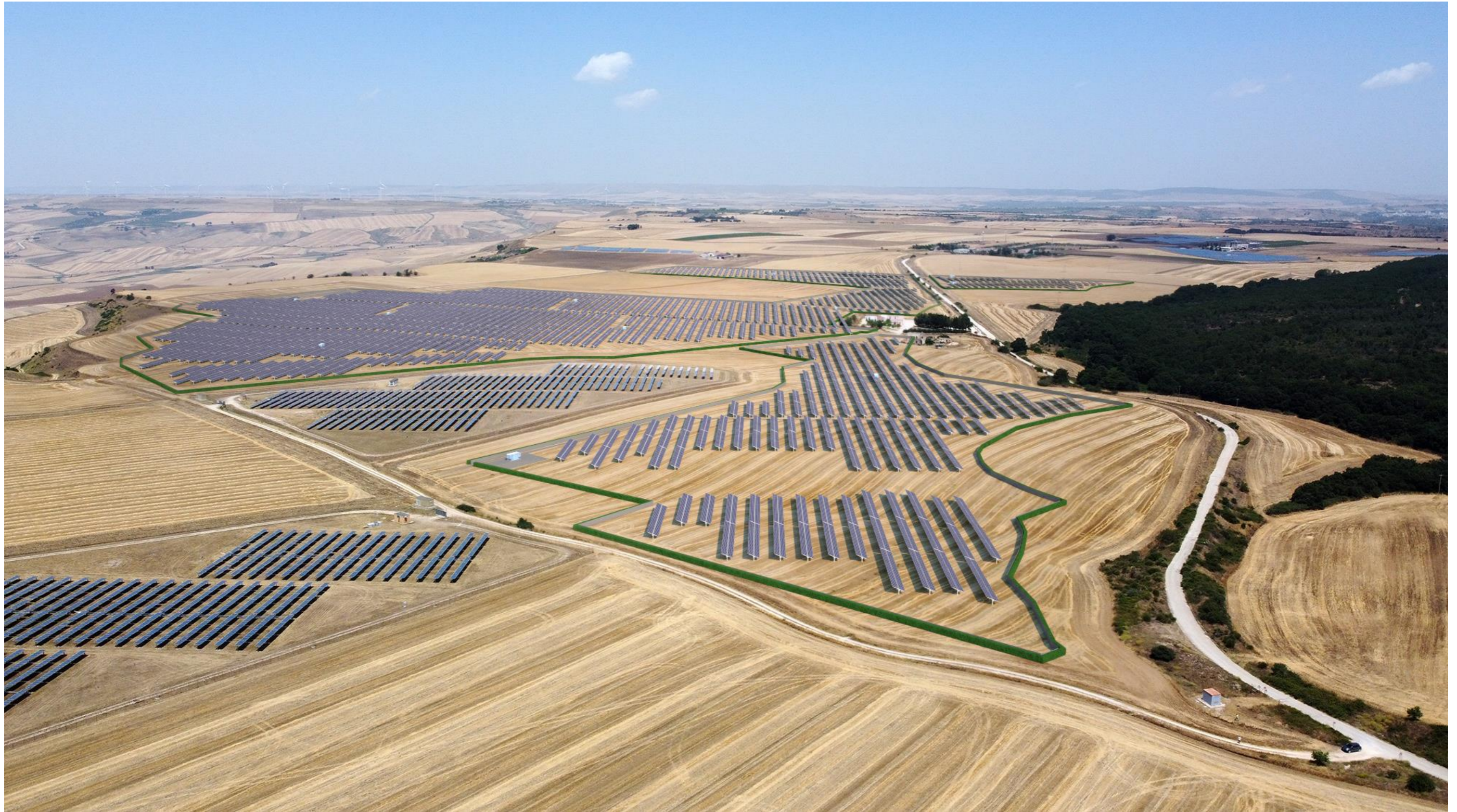
Punto di scatto aereo SUD – fotosimulazione