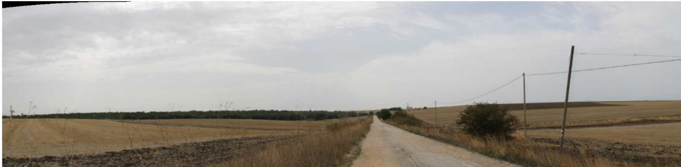
Punto di scatto 4 – Stato di fatto