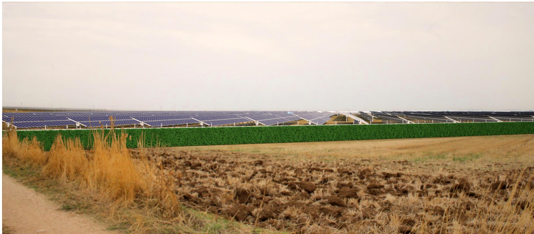
Punto di scatto 5 – Fotosimulazione