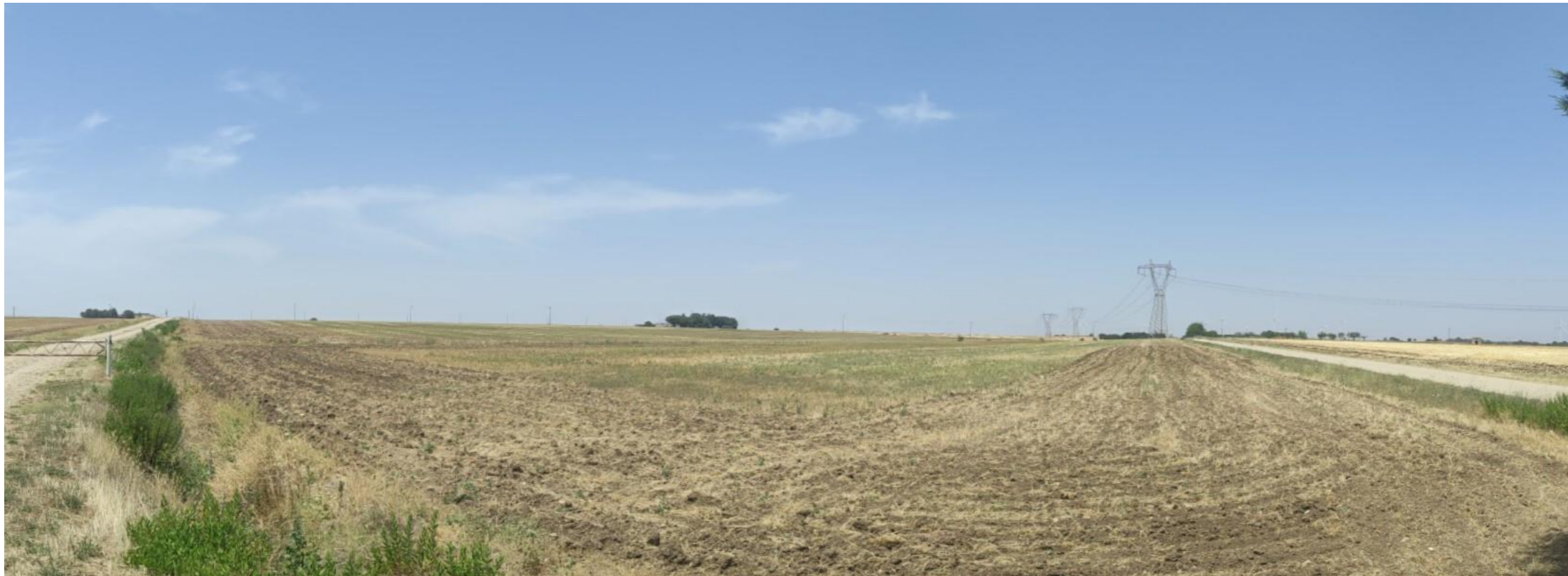
Punto di scatto SET 1 – Stato di Fatto