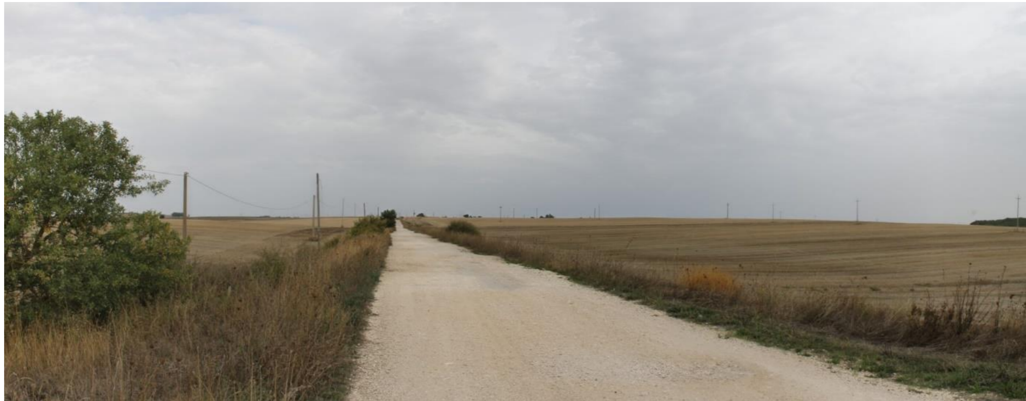
Punto di scatto 3 – Stato di fatto