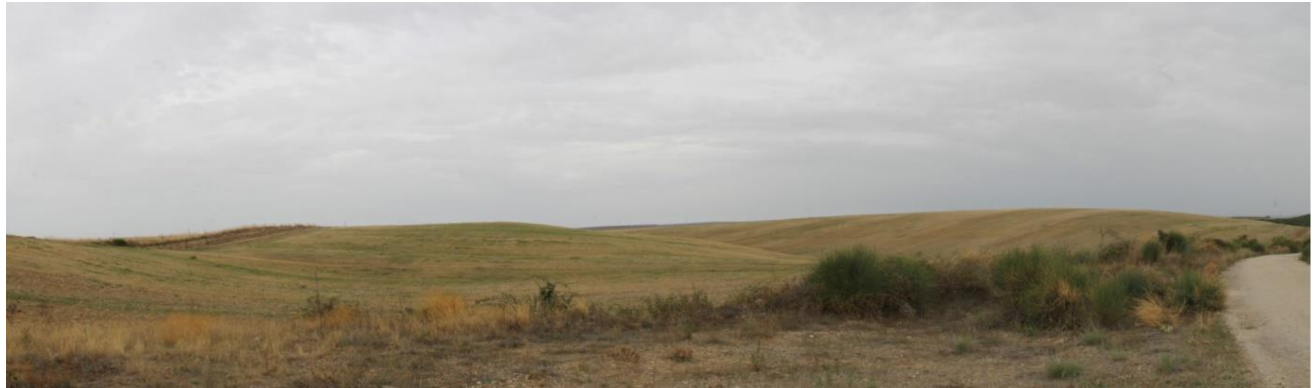
Punto di scatto 1 – Stato di Fatto