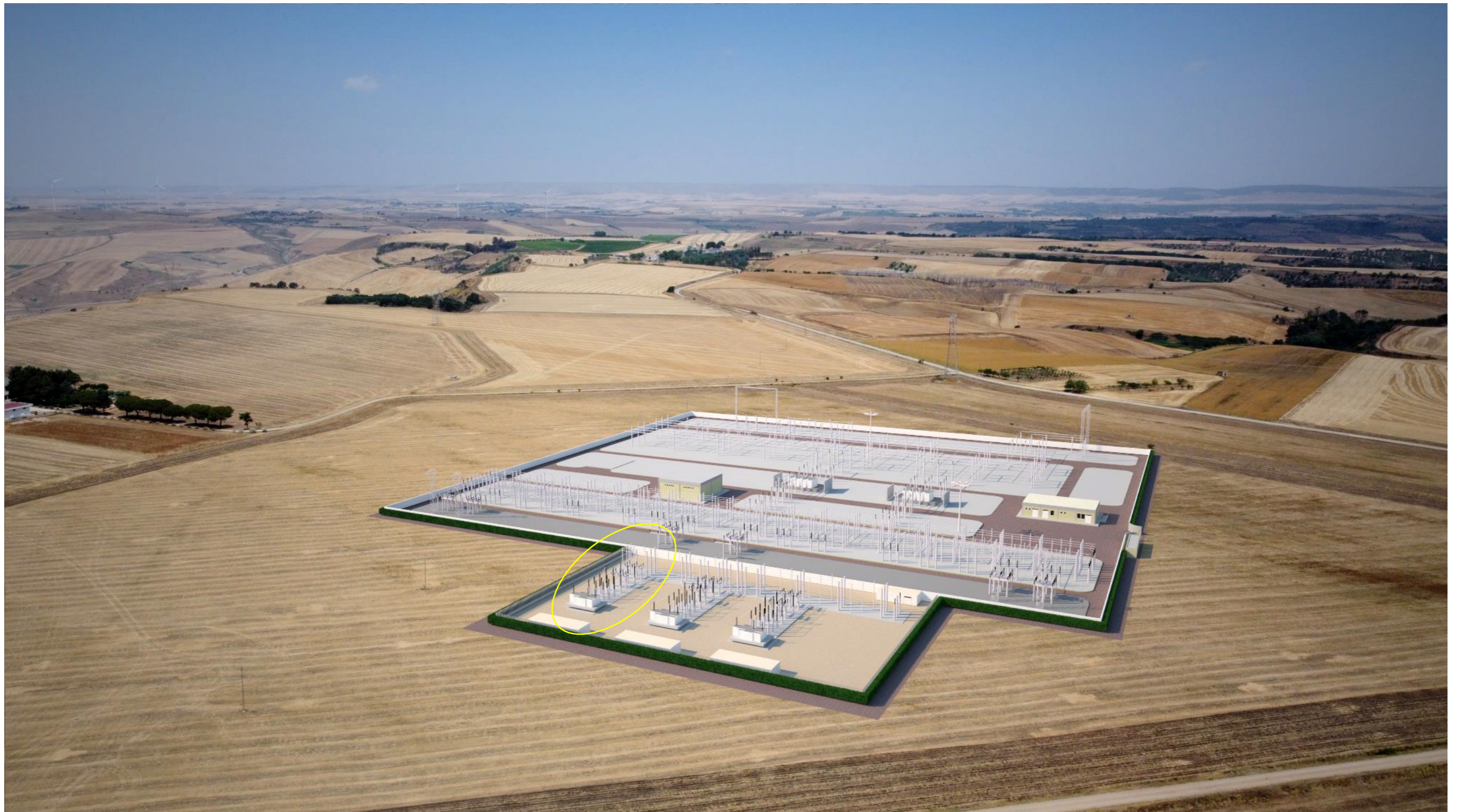
Punto di scatto aereo SET – fotosimulazione (lo stallo relativo al progetto Loschiavo è evidenziato con cerchio giallo. La restante opera rappresenta la futura stazione Terna ed i restanti stalli della stazione condivisa)