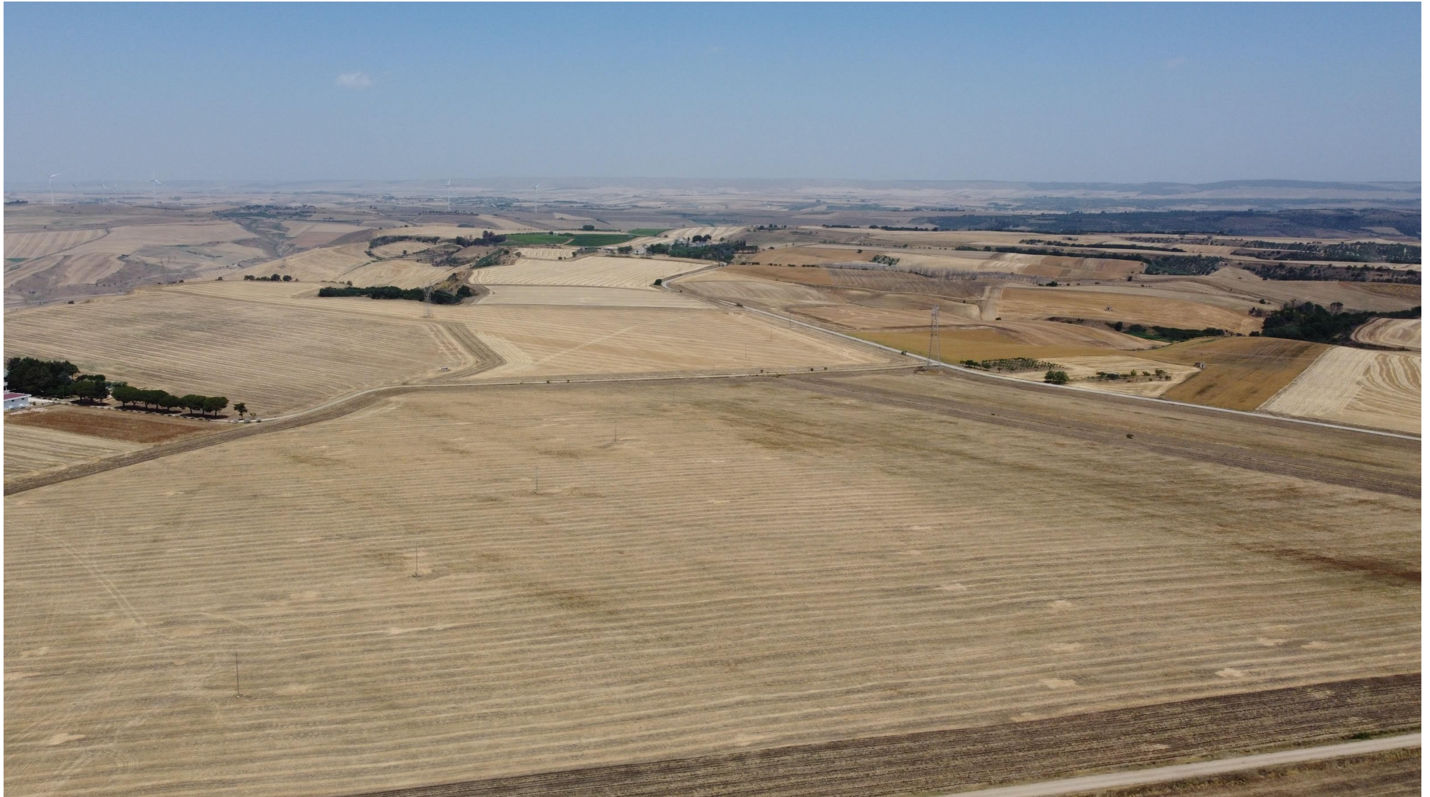
Punto di scatto aereo SET – Stato di fatto