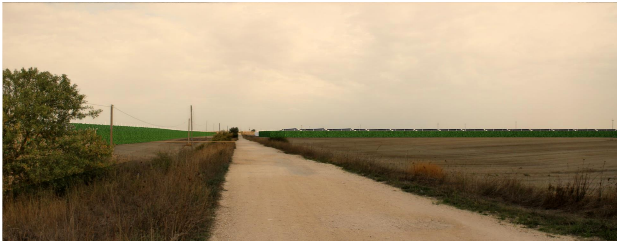
Punto di scatto 3 – Fotosimulazione.