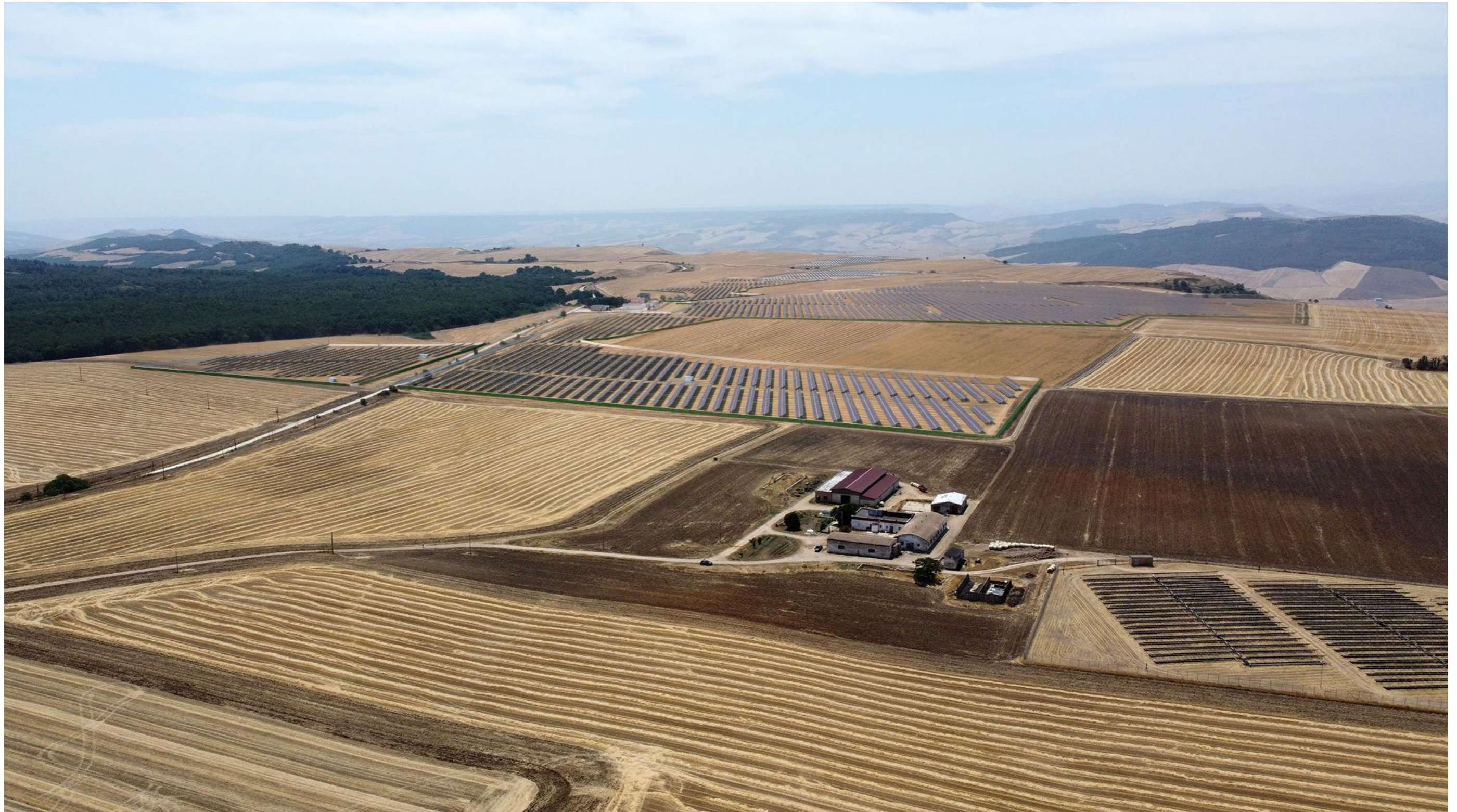
Punto di scatto aereo NORD – fotosimulazione