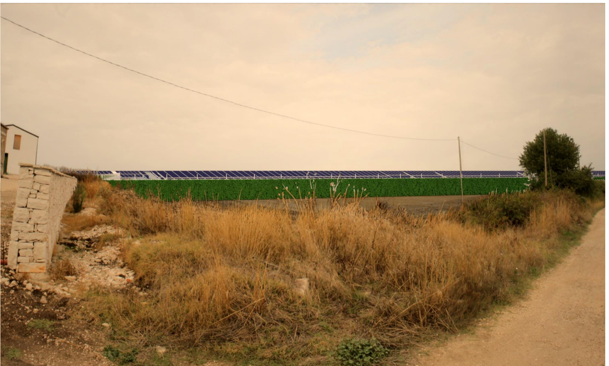
Punto di scatto 2 – Fotosimulazione