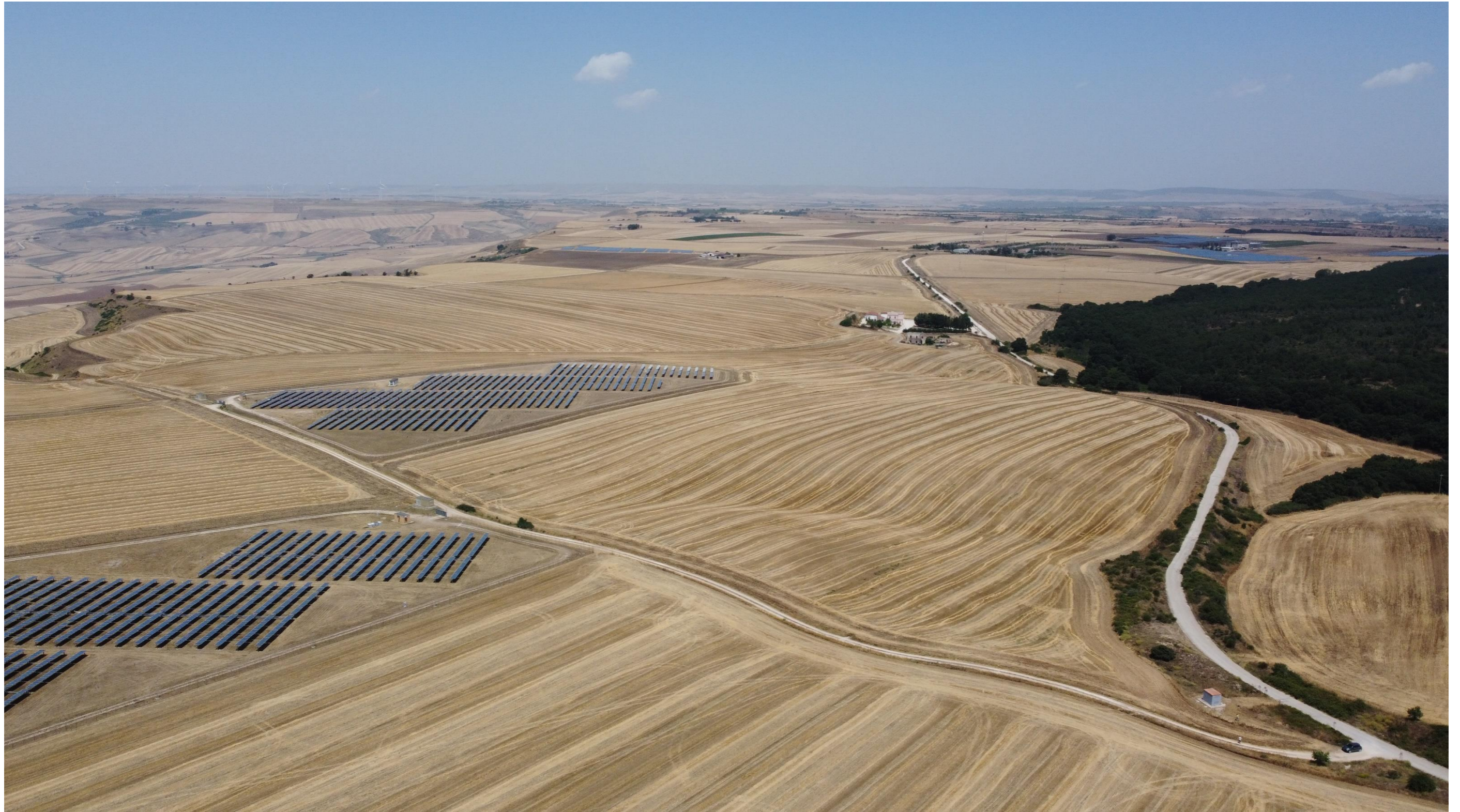
Punto di scatto aereo SUD – Stato di fatto