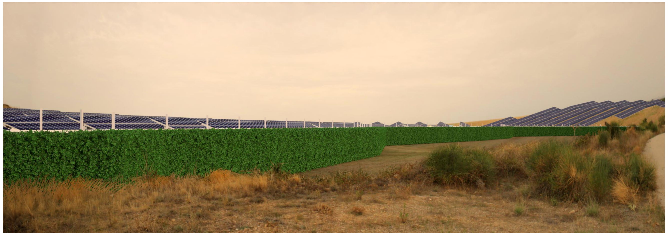
Punto di scatto 1 – Fotosimulazione