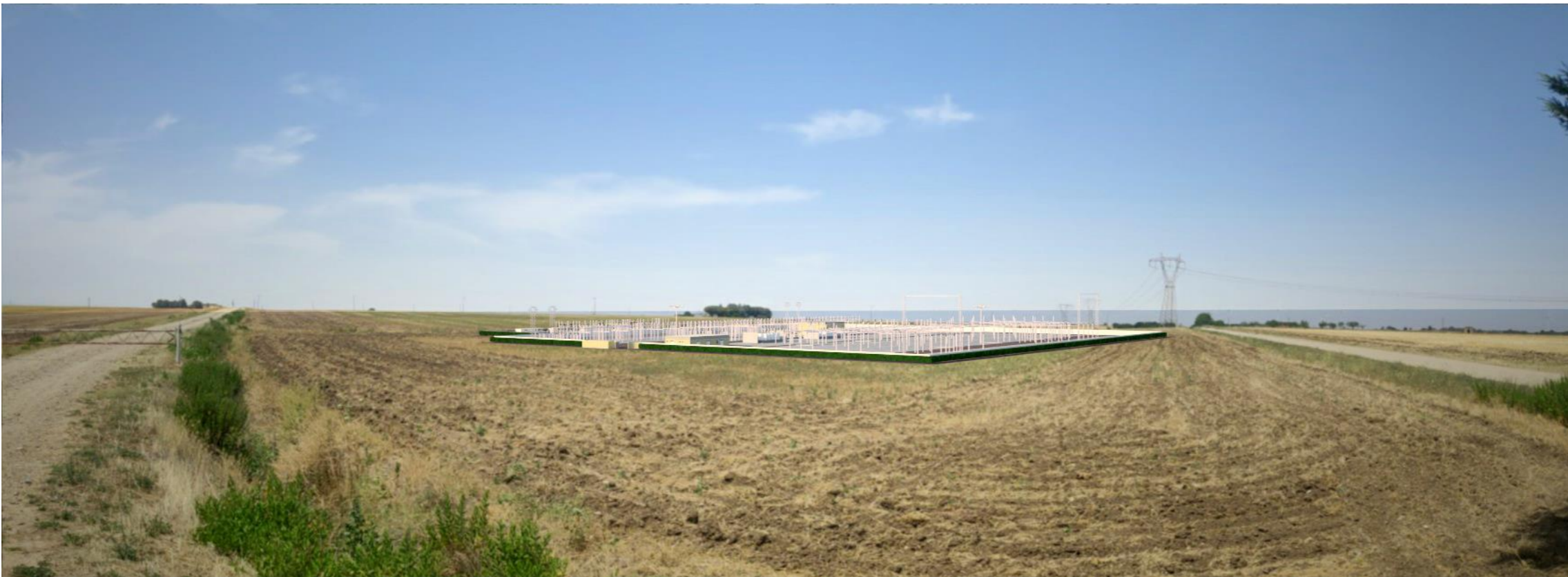
Punto di scatto SET 1 – fotosimulazione