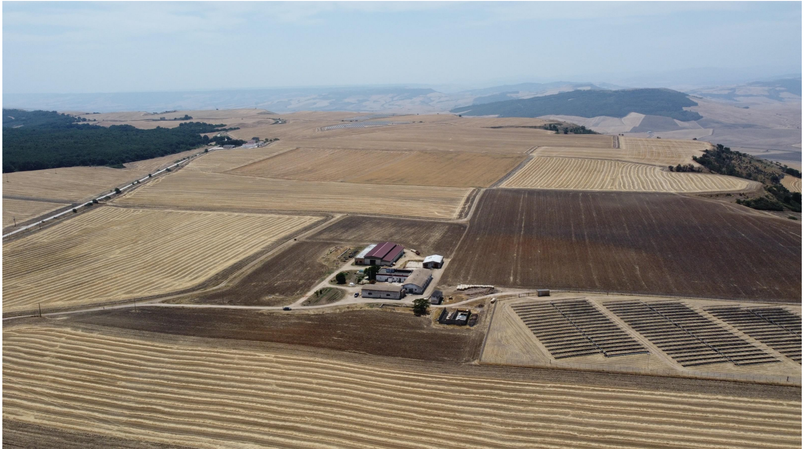
Punto di scatto aereo NORD – Stato di Fatto