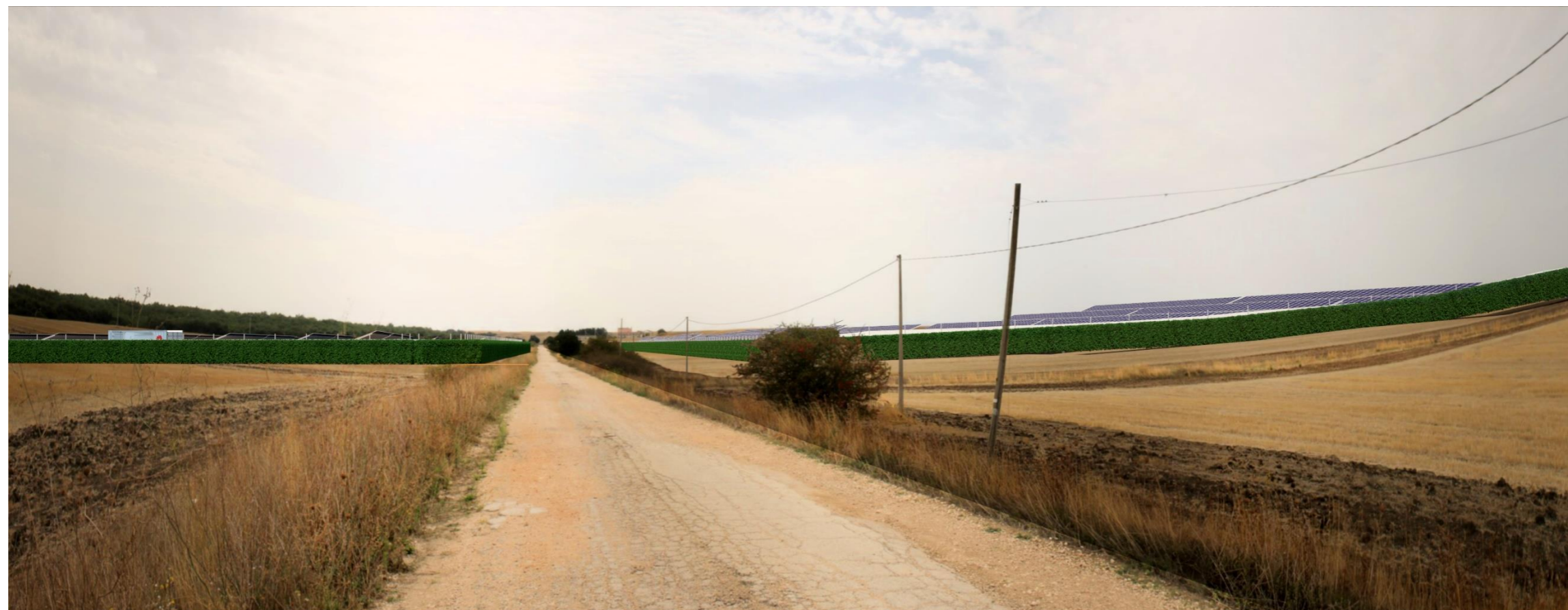
Punto di scatto 4 – Fotosimulazione