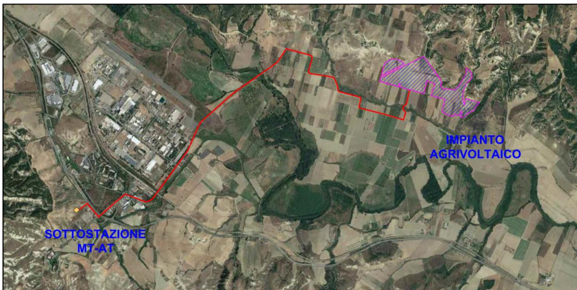
Figura 1 - Individuazione su ortofoto dell'area di impianto