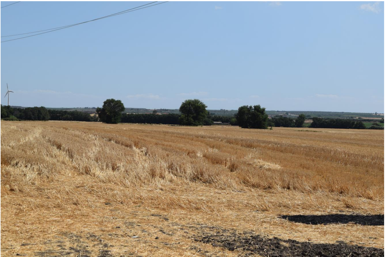
Figura 13: Vista fotografica P12; l'impianto è situato nelle vicinanze dell'uliveto