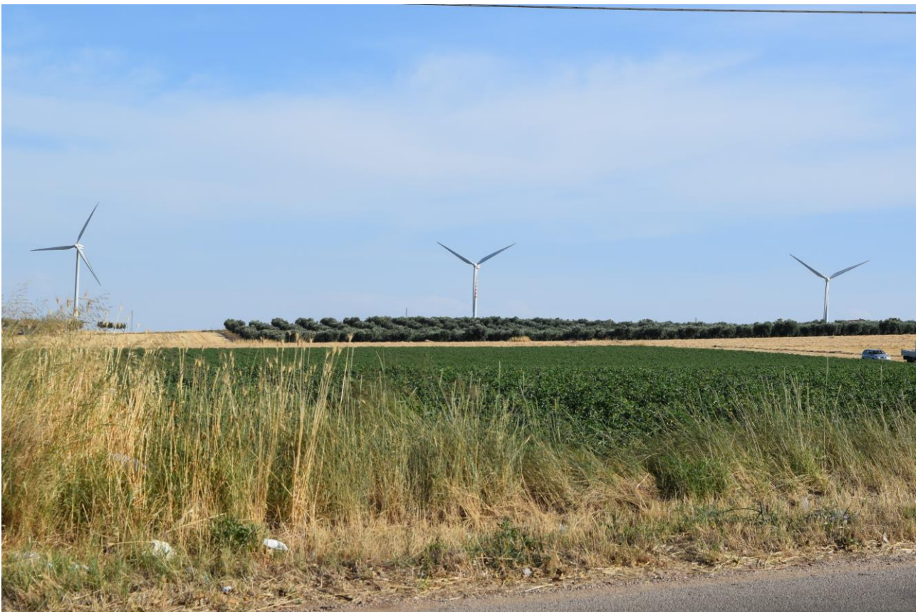
Figura 2: Vista fotografica P1; l'impianto è situato alle spalle del parco eolico