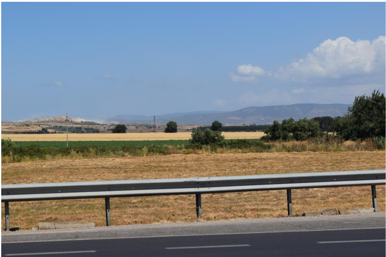
Figura 6: Vista fotografica P5; l'impianto è situato alle spalle della linea AT