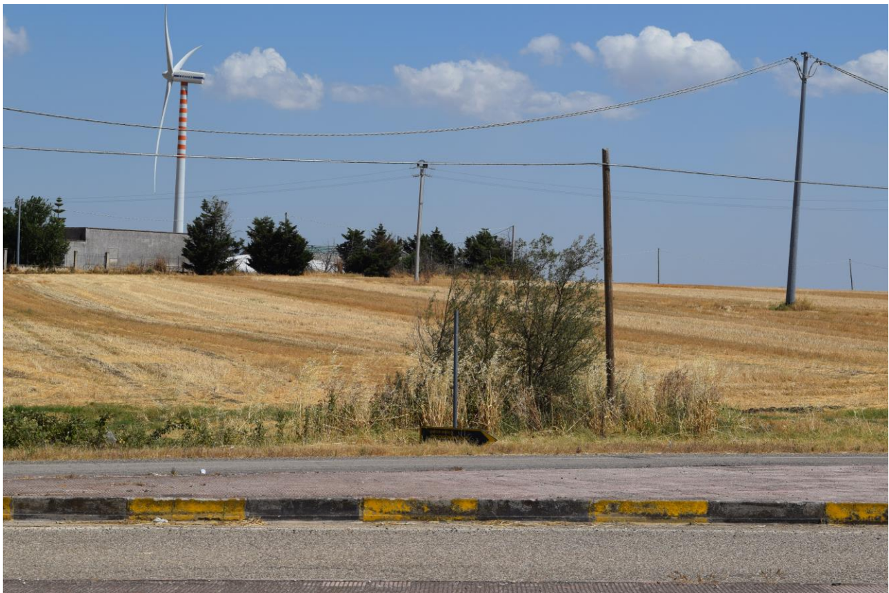
Figura 4: Vista fotografica P3; l'impianto è situato alle spalle della pala eolica