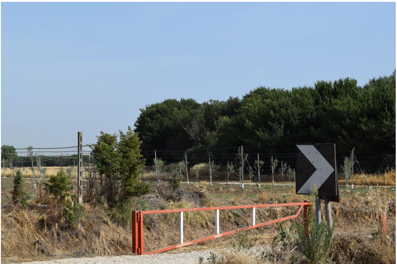
Figura 8: Vista fotografica P7; l'impianto è situato alle spalle dell'uliveto