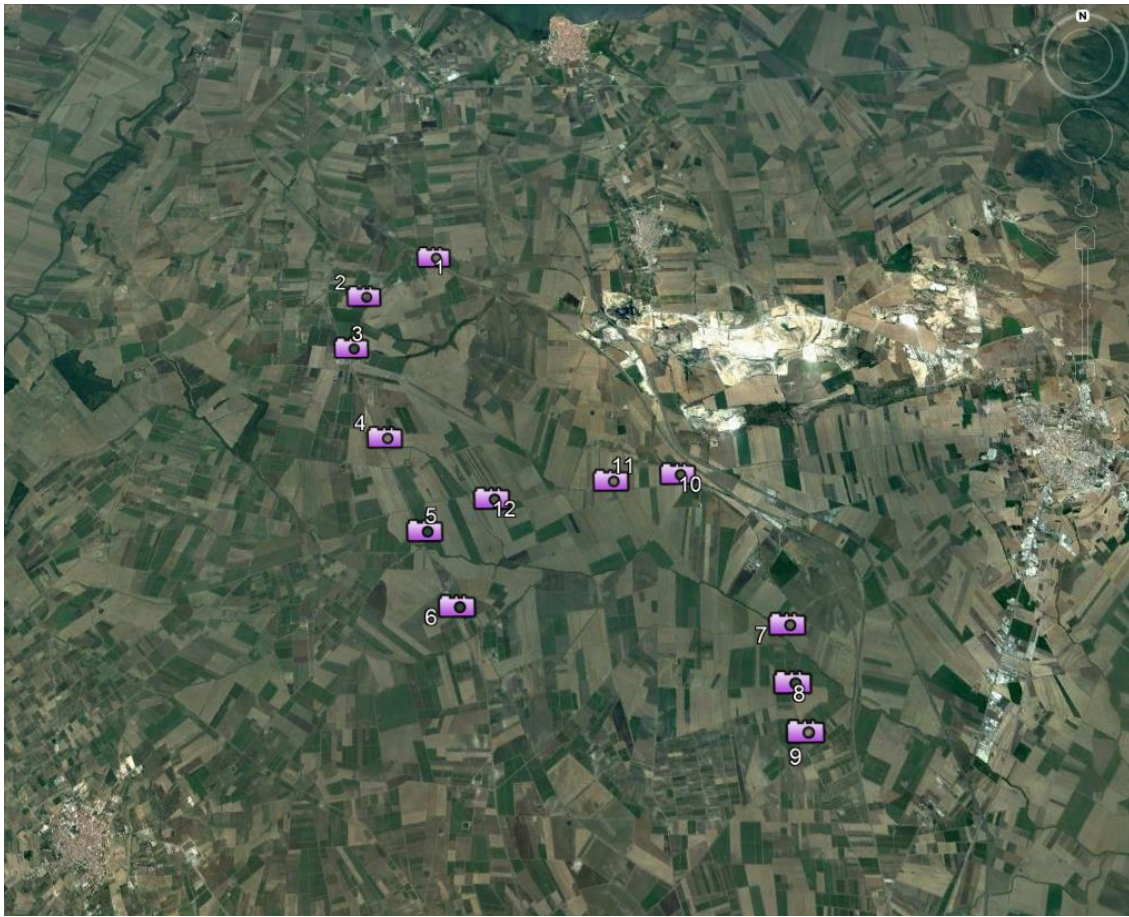
Figura 1: Mappa chiave punti di scatto