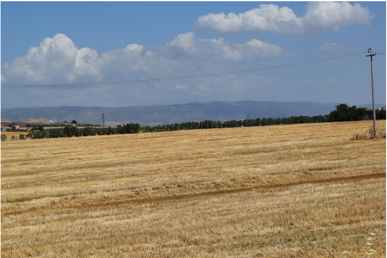
Figura 5: Vista fotografica P4; l'impianto è situato alle spalle della linea AT