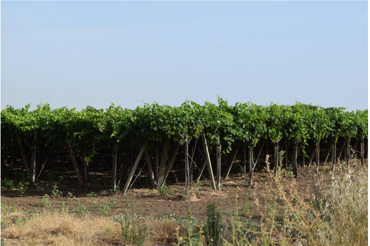
Figura 9: Vista fotografica P8; l'impianto è situato alle spalle dell'uliveto