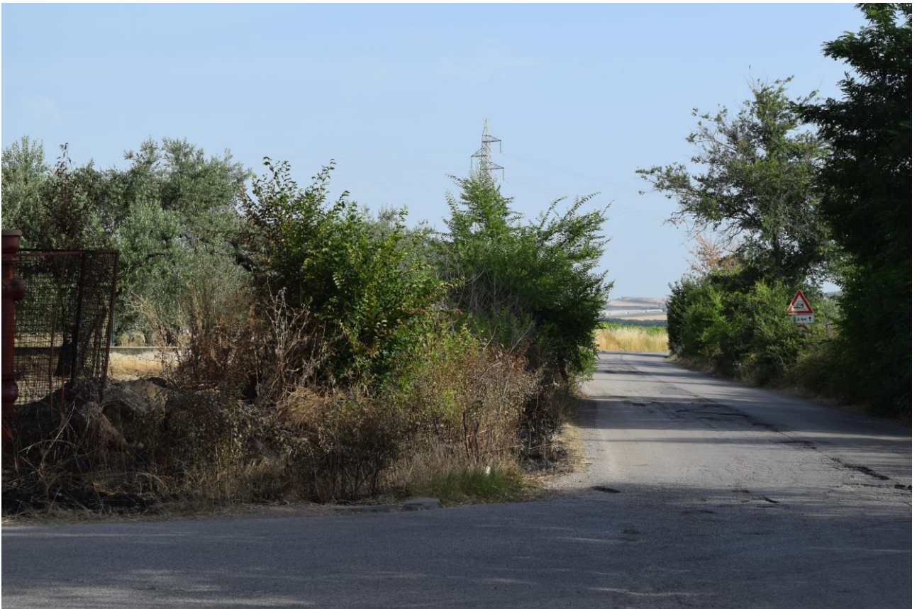
Figura 10: Vista fotografica P9; l'impianto è situato alle spalle della vegetazione