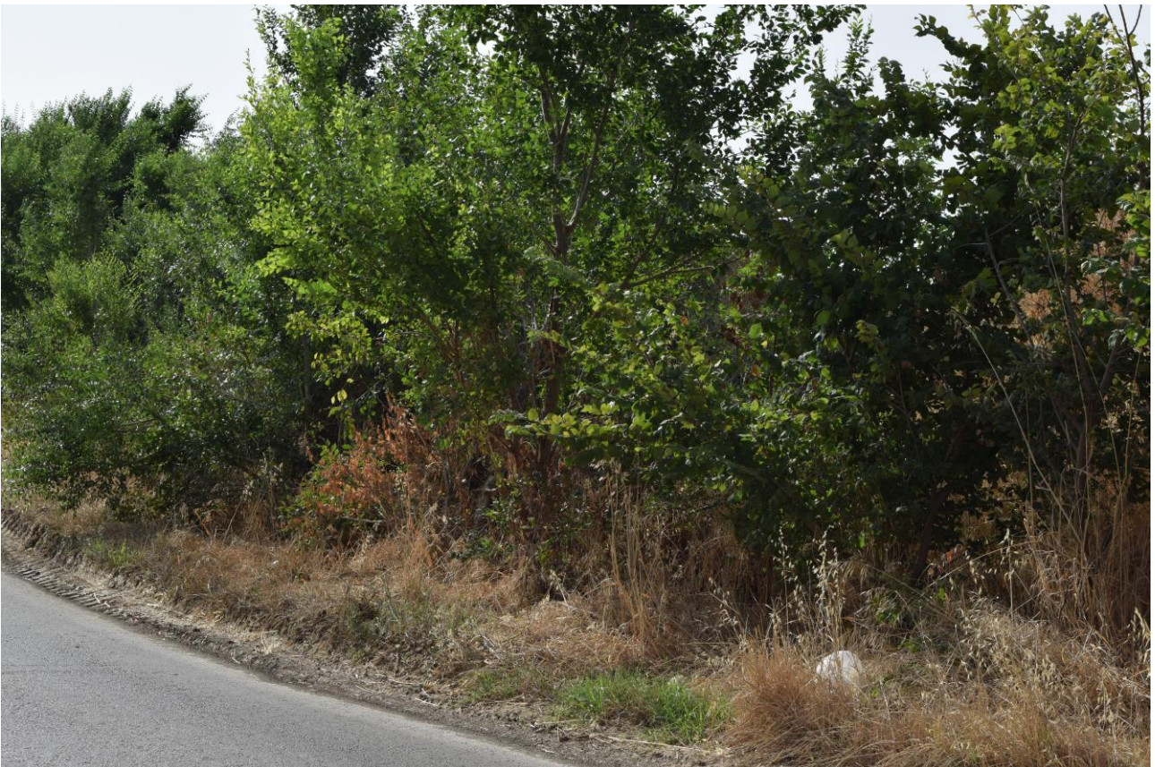
Figura 12: Vista fotografica P11; l'impianto è situato alle spalle del muro vegetale