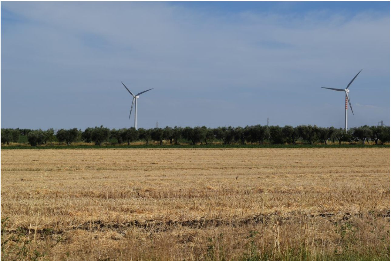
Figura 3: Vista fotografica P2; l'impianto è situato alle spalle del parco eolico