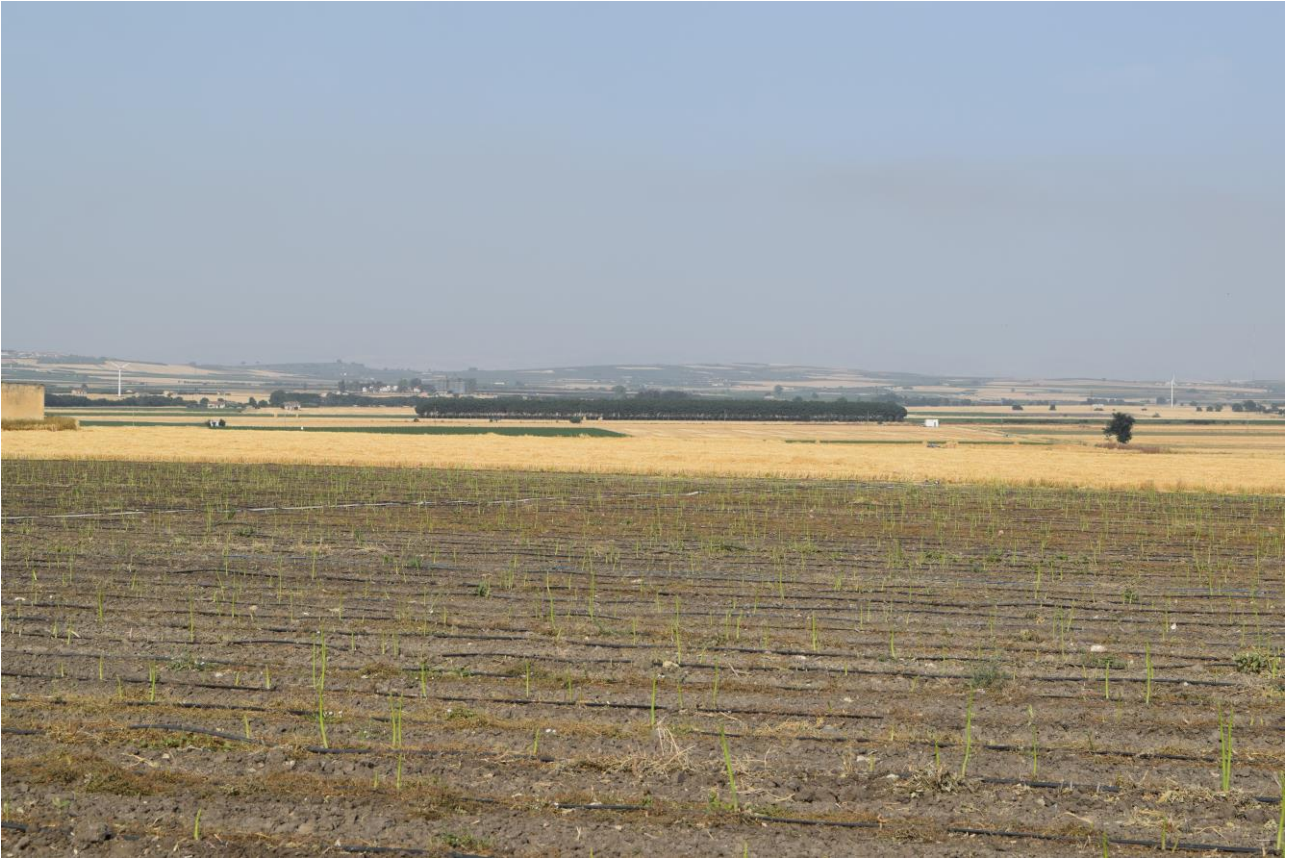
Figura 11: Vista fotografica P10; l'impianto è situato nelle vicinanze dell'uliveto