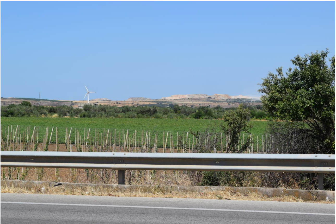
Figura 7: Vista fotografica P6; l'impianto è situato alle spalle dell'uliveto