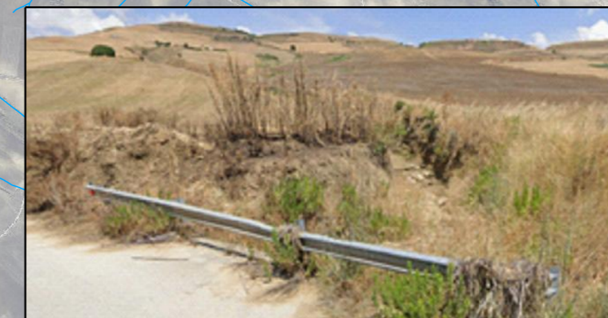
RI-004 Stabilizzazione e ricostruzione assetti geomorfologici e idrogeologici