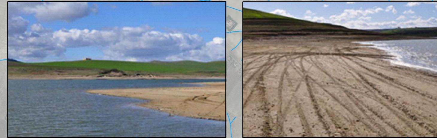
RI-001 Co-finanziamento attività di drenaggio nell'invaso di Serra del Corvo