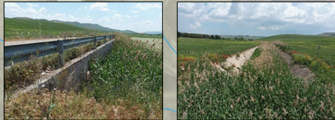
RI-003 Sistemazioni idrauliche lungo il reticolo idrografico locale