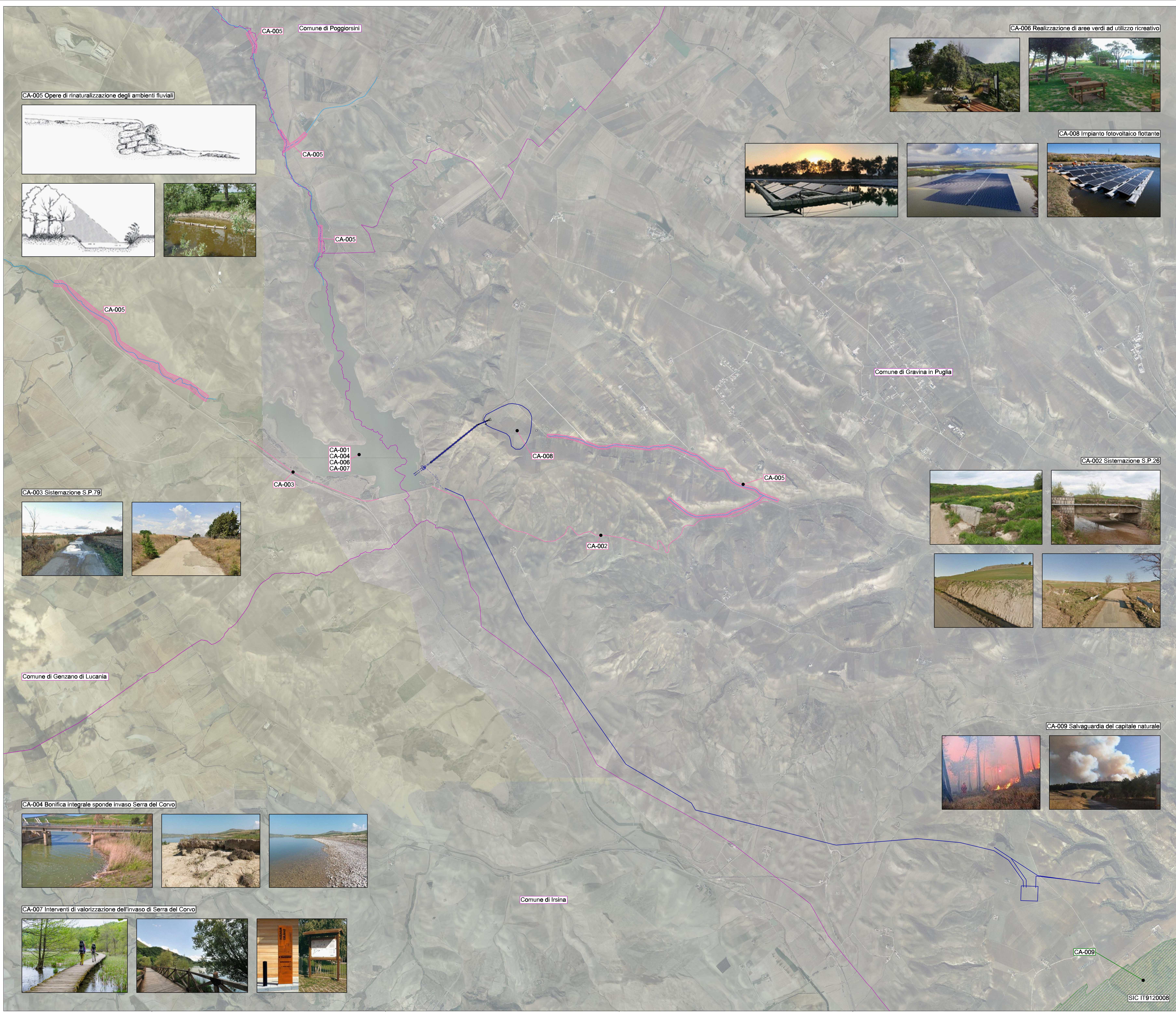
CA-005 Opere di rinaturalizzazione degli ambienti fluviali