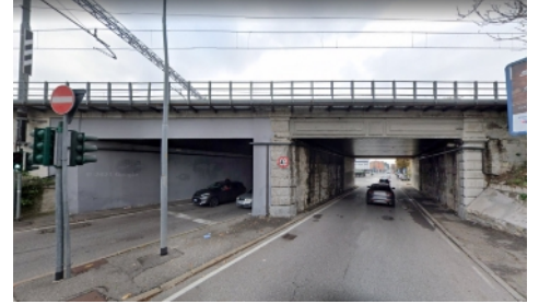
Vista di insieme del Ponte ferroviario da nord. La parte di sinistra risulta essere stata costruita nel 1960.