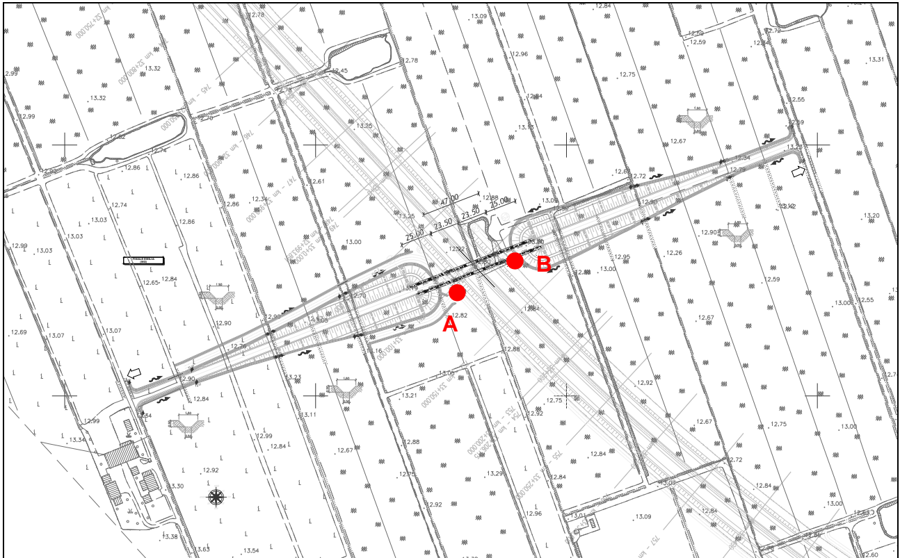
Figura 8.1 – Indicazioni dei punti di scarico più significativi sottoposti a verifica

Considerando pertanto i 2 fossi, nei tratti finali per la Cavalcavia V28 le verifiche idrauliche portano ai seguenti risultati.