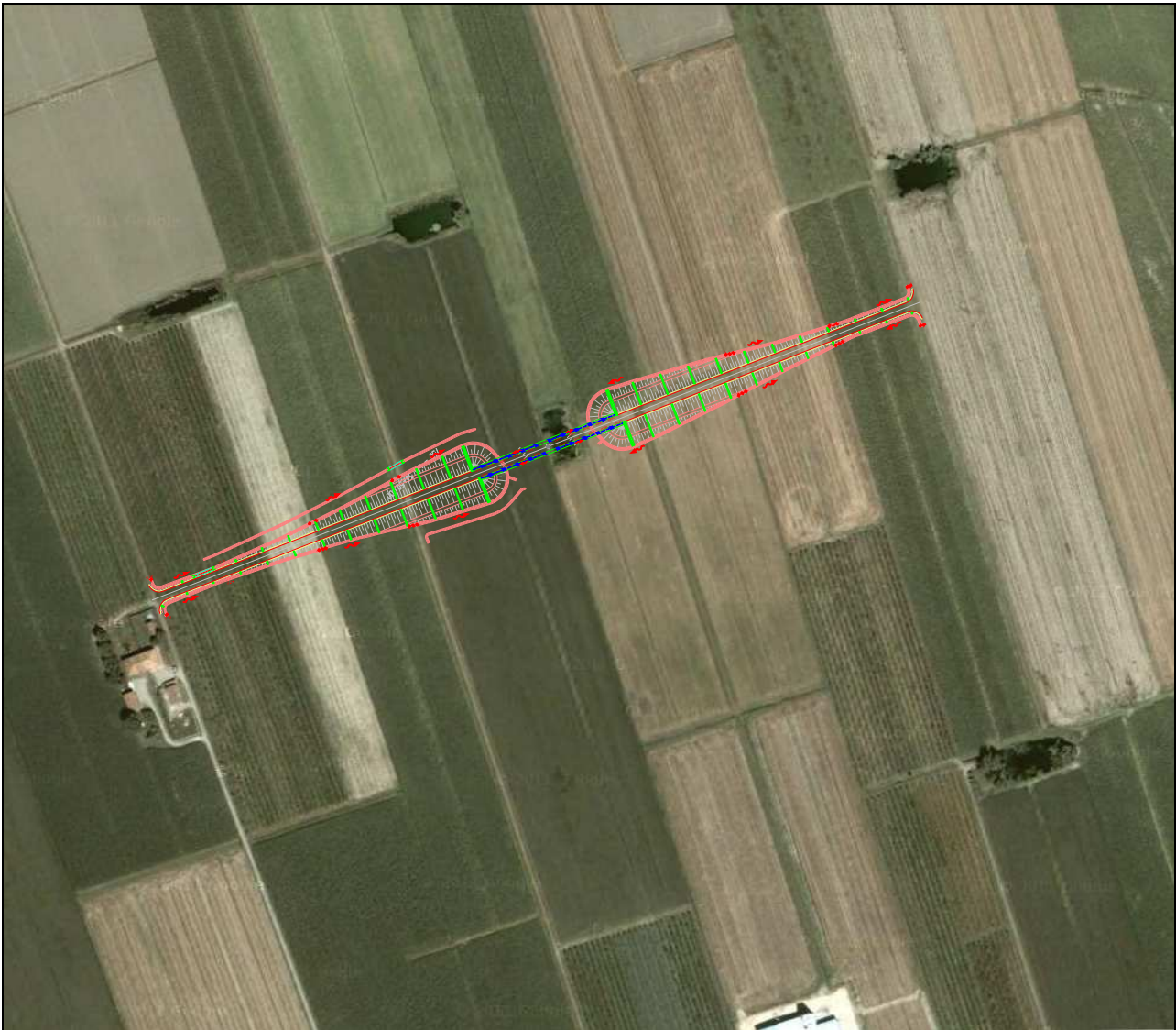
Figura 3.1 – Immagine area con sovrapposta l'opera

Nella Figura seguente si è riportata la foto aerea dell'area su cui è inserita l'opera.