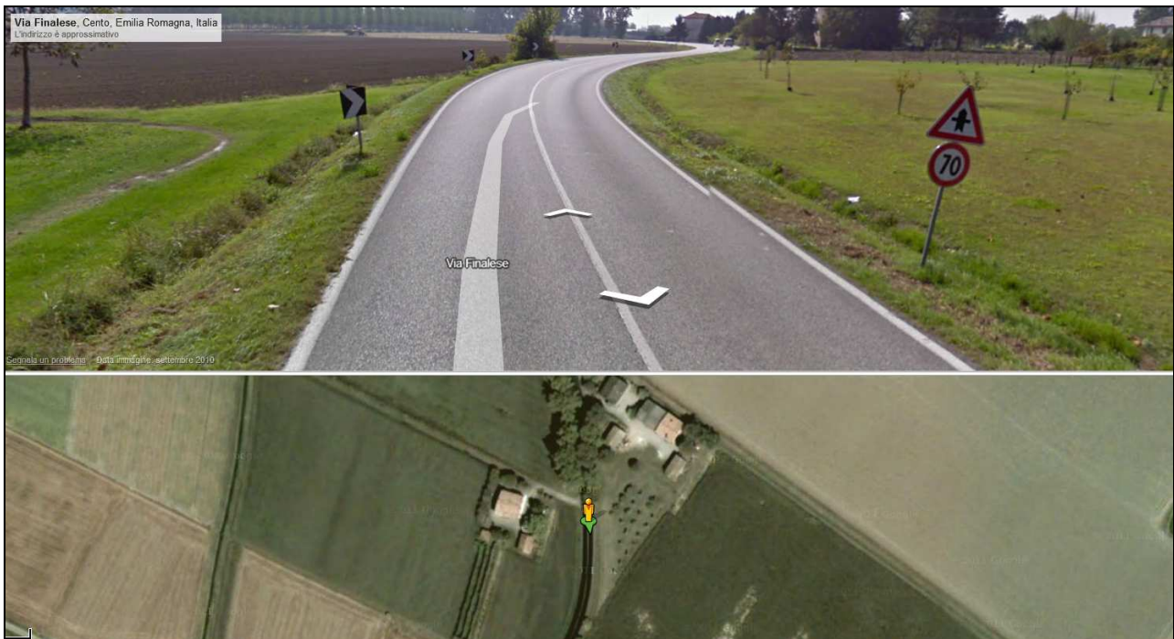
Figura 4.1 – Immagine della strada alla stato attuale con i fossi a bordo strada.

Nel caso in esame si hanno interferenze solo con fossi stradali.