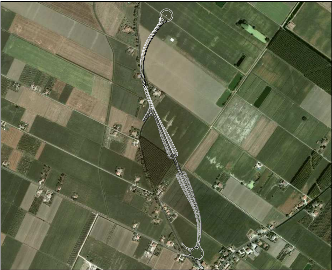
Figura 3.1 – Immagine area con sovrapposta l'opera

Nella Figura seguente si è riportata la foto aerea dell'area su cui è inserita l'opera.