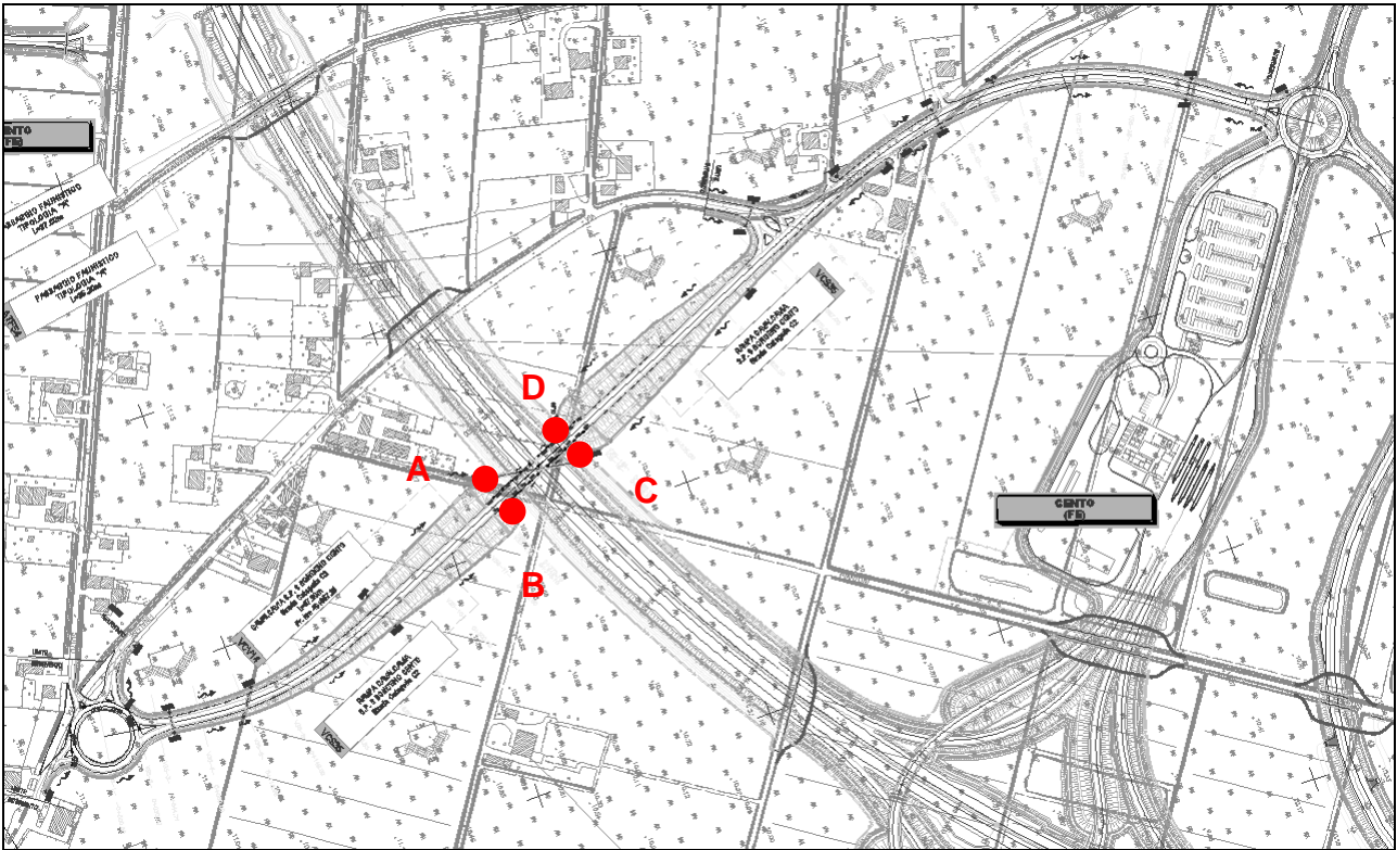
Figura 8.1 – Indicazioni dei punti di scarico più significativi sottoposti a verifica

Considerando pertanto i 4 punti, nei tratti finali per il Cavalcavia V35 le verifiche idrauliche portano ai seguenti risultati.