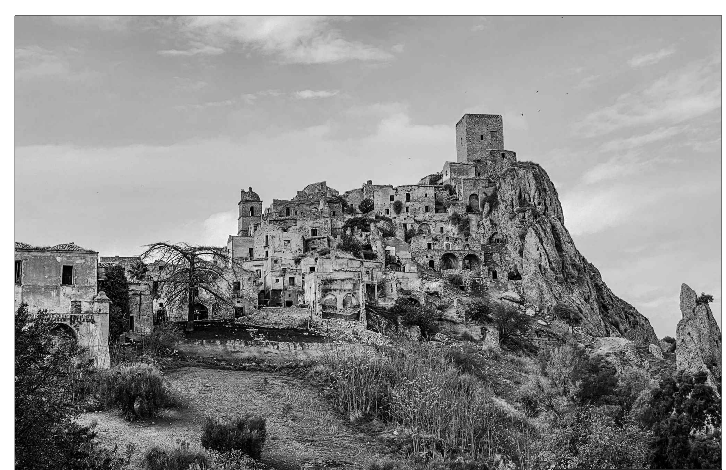
SERRA CARUSO MORÈ