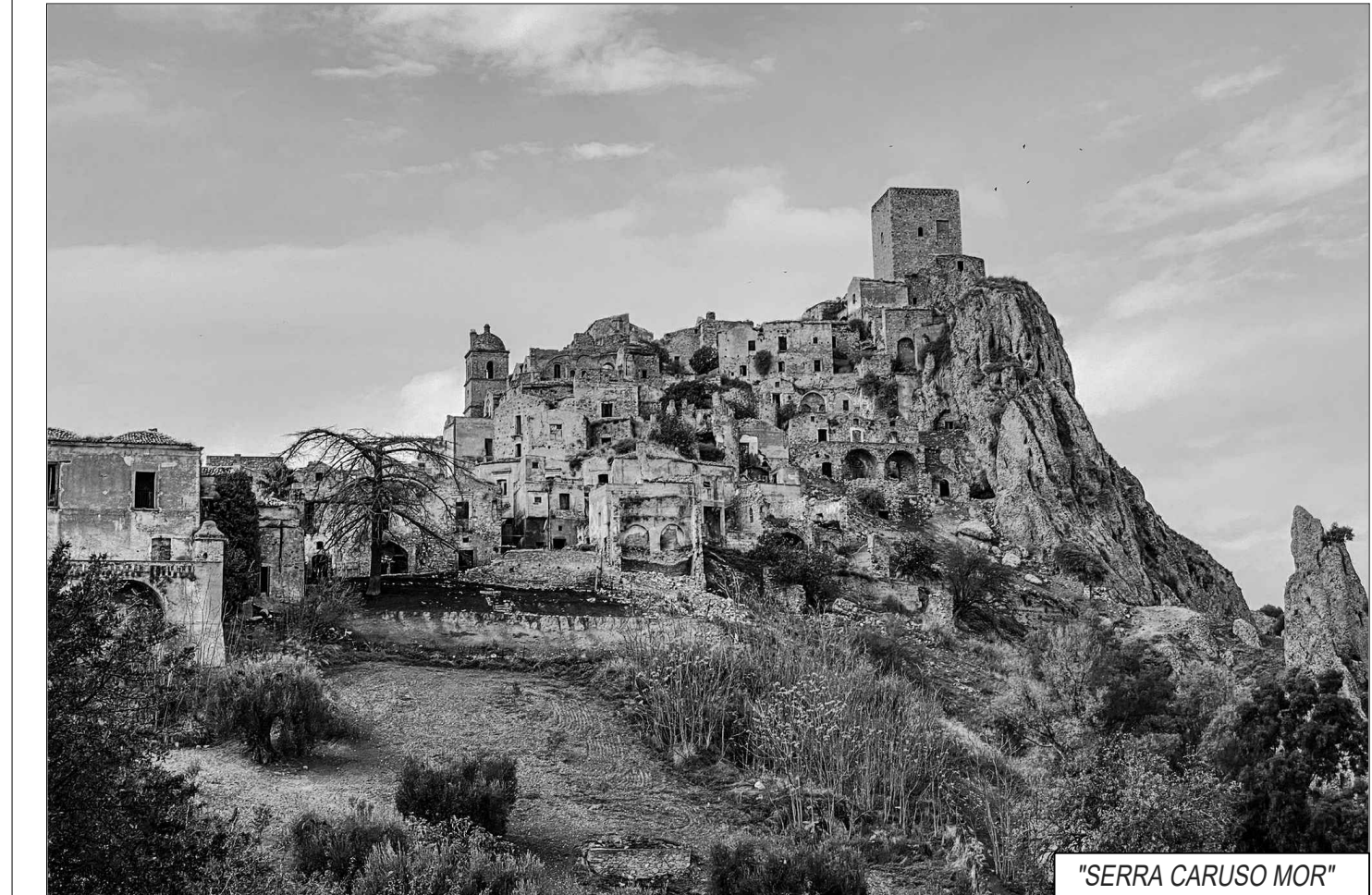
"SERRA CARUSO MOR"