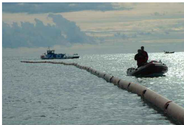
Dispiegamento della barriera antitorbidità