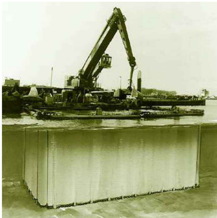
Rendering di un'area di dragaggio perimetrata da panne in una situazione ideale di acque calme