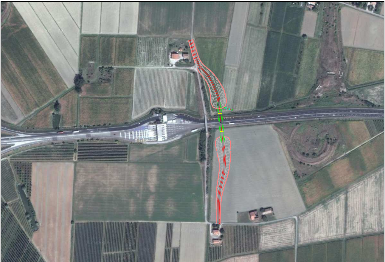
Figura 3.1 – Immagine area con sovrapposta l'opera

Nella Figura seguente si è riportata la foto aerea dell'area su cui è inserita l'opera.