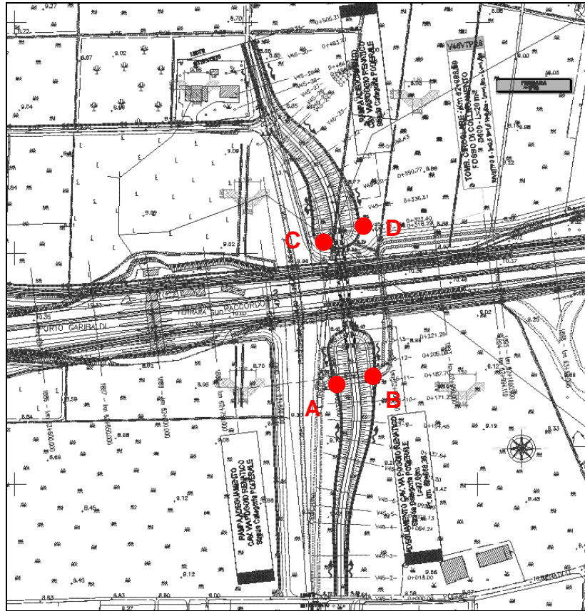
Figura 8.1 – Indicazioni dei punti di scarico più significativi sottoposti a verifica

Considerando pertanto i 4 fossi, nei tratti finali per il Cavalcavia V45 le verifiche idrauliche portano ai seguenti risultati.