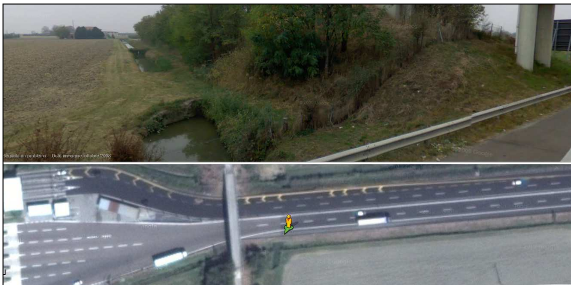
Figura 4.1 – Immagine della Traversa Cecchina di fianco al cavalcavia esistente.

I fossi sopra ricordati rappresentano anche i recapiti delle acque del cavalcavia e secondo le indicazioni del Consorzio di Bonifica si provvederà a garantire dei volumi adeguati per la laminazione delle acque.