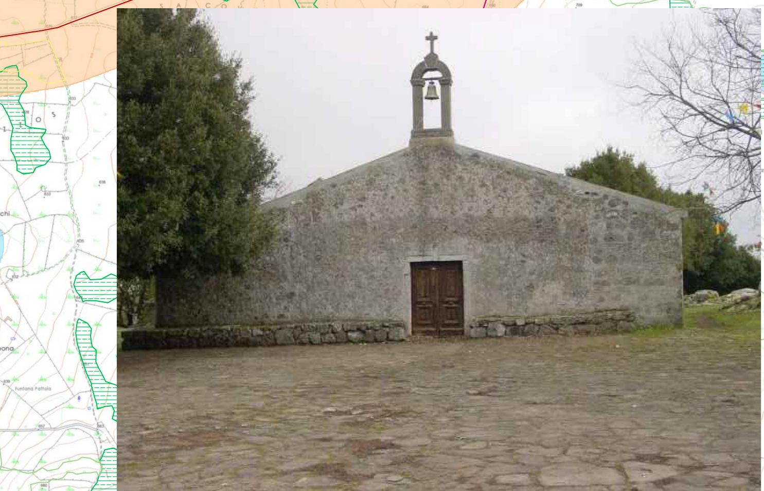
Chiesa di Sant'Antonio La chiesa si trova sulla sommità del monte S. Antonio e sorge immersa nella vegetazione del bosco.

Nuraghe su Tillipiriche I resti del nuraghe sorgono poco lontano dal centro abitato di Macomer e sono stati inclusi in un progetto di riqualificazione urbana che ha previsto la creazione del "Parco dei due Nuraghi" costituito dal nuraghe su Tillipiriche e dal nuraghe Corte posti a circa 400 m uno dall'altro. Il Parco dei due Nuraghi si inserisce nel piano di recupero urbano del quartiere residenziale Santa Maria.